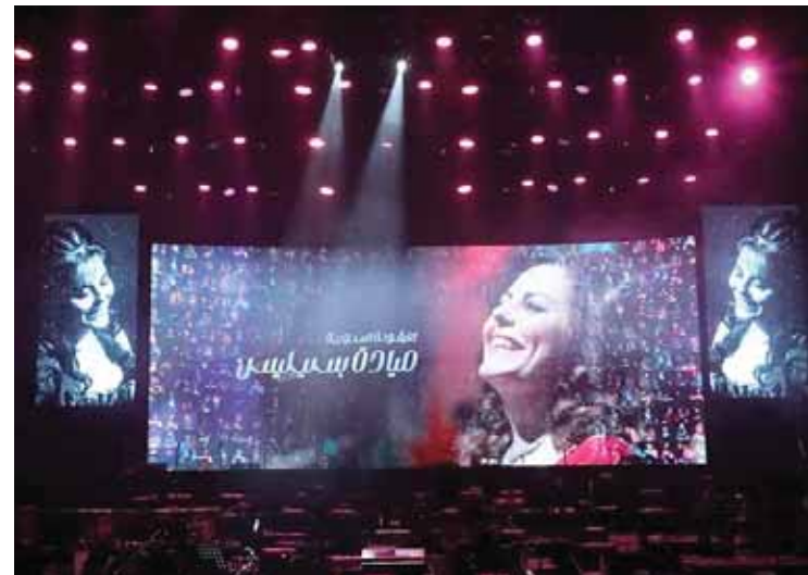
من حفل التكريم

كانت من أجل الأصوات على مستوى سورية والوطن العربي. أما شهد برما فكانت مثل على حبيها وروحها الحلوة فكانت مثل الملك بيننا.