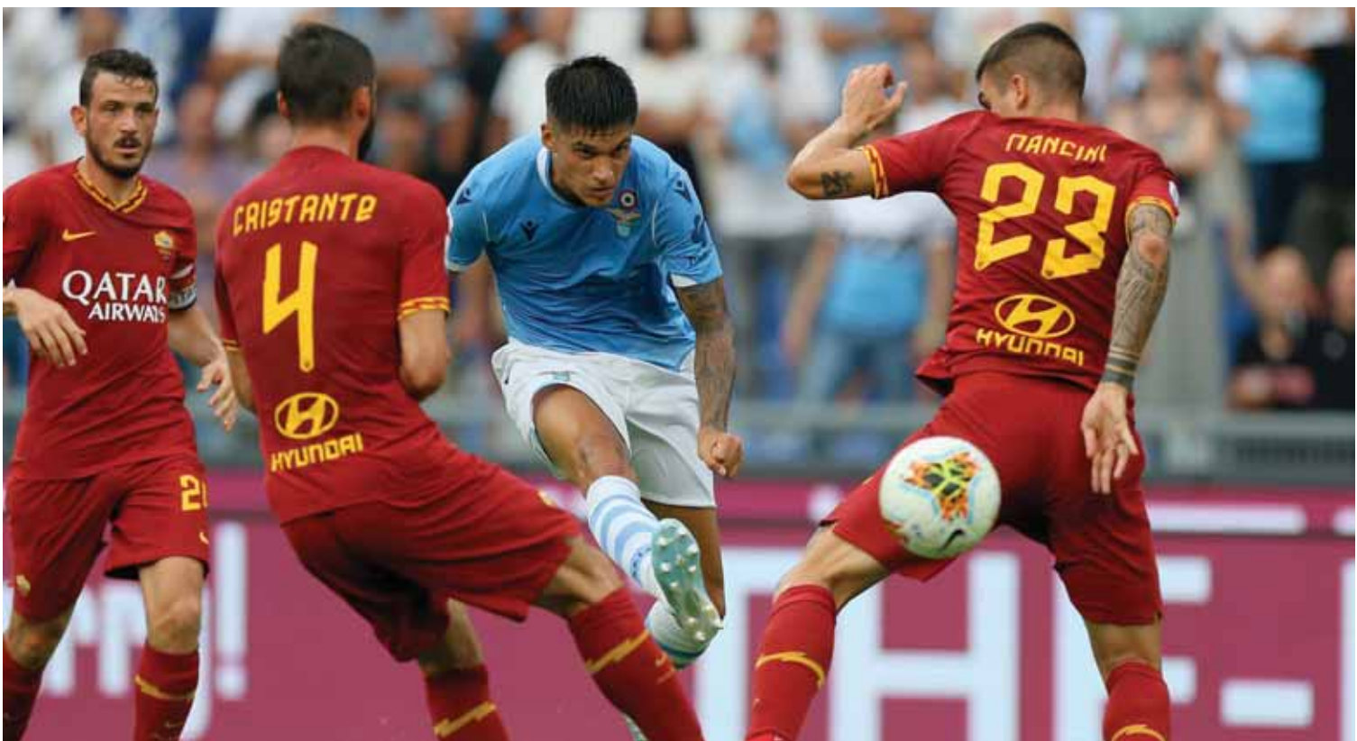
من أشرىة الذئاب والنسر

الثالثة أمام الذئاب في آخر أربع مواجهات دون فوز للفوز الأخير للفيرون كان خارج أرضه عام ٢٠١٩، لن يكون لايزينغ بعيداً عن المنافسة وقد ارتاح أوروبا في قتالهم إلى ربع نهائي اليوروبالغ دون لعب ويستقبل اليوم فراكفورت المتامل بدوره إلى الدور ذاته على أمل التقدم على الجدول وهو الذي لديه الرصيد ذاته مع فرايبورغ وموفنتهايم، وكان الفريقان تعادلا ذهاباً بهدف لثله.