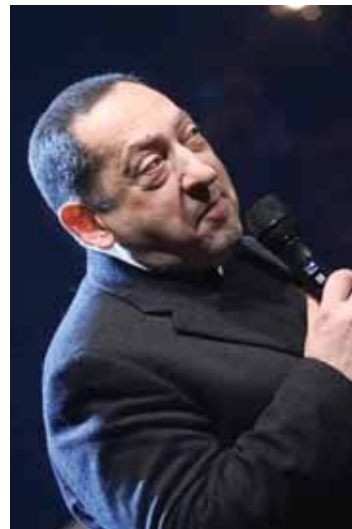
الموسيقار سمير كوياتي

ابنة مدينة حلب التي ولدت عام ١٩٦٧ بدأت أول أعمالها الفنية وهي في التاسعة من عمرها عبر إذاعة حلب، ففتحت لأطفال ضمن برنامج (حكايات العم رضوان)، وأصدرت أول البوم لها عام ١٩٨٦ بعنوان «يا قاتلي بالهجر»، لتقدم ١٤ ألبوماً غنائياً خلال مسيرة عطائها الفني، التي حصلت فيها العديد من الجوائز في سورية وخارجها. الفنانة التي شكلتها الراحلة مع زوجها الموسيقار سمير كوياتي شكلت بصمة خاصة بهما في صناعة الأغنية السورية، وبدوا بغناء شعر ملحن مشهور أضاف عليه كوياتي بعضاً من لمساته في الألبان، ثم غنت الراحلة من نصوص جبران خليل جبران وكان أمها «بإله يا قلبي أتم هواك»، لتتوالى بعدها الأعمال الخاصة بهما ويحقق نجاحات لا تتوقف.