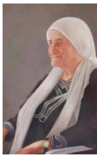
الأم سهيل بدور

وتوفر سبل العيش للإنسان، كذلك الأم، وتتميز لوحات الأمهات منذ القرن الـ ١٨ وحتى مطلع القرن العشرين بلحميتها الواقعية، نرى مثلاً في لوحة «أم مع طفلها» للرسام الفرنسي ليون جان بازيل بيرولت (١٨٣٢-١٩٠٨) امرأة تقبل طفلها وإلى جوارها بكرة من الخيط تصنع منها ثياباً جديدة للصغيرة.