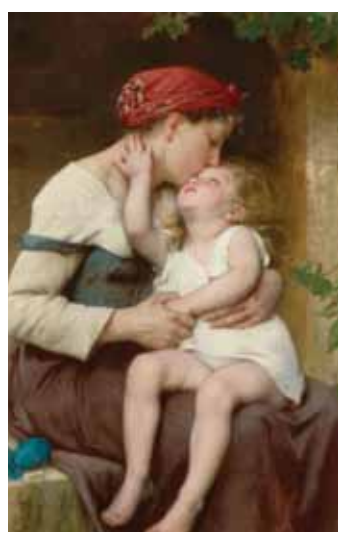
.. ولجان بازيل