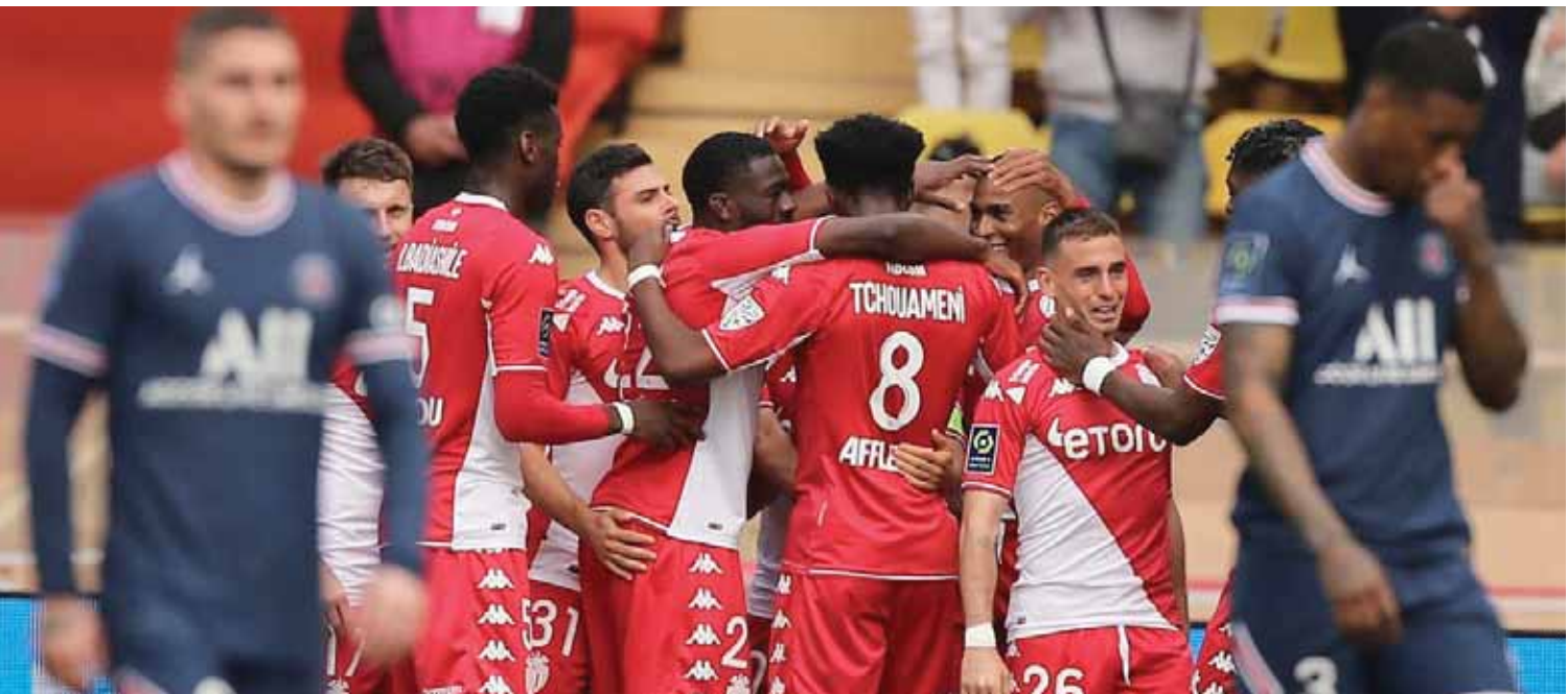
موناكو أثل على الباريسي