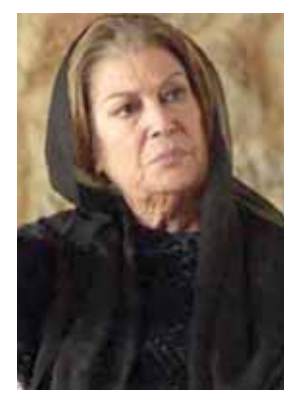
سيدة دور الأمومة في الدراما التلفزيونية كانت الأمومة فاضت عليه.. اعطته فما استجاب

لست محدودة بيوم.. يختصر القساة بيوم وحده يجعلك كل الأيام في الرحمة غنى المغفون.. أشد المششون قال الشعراء.. كتبت الأقدام كل ما فعلوه أنهم تطرو بك اقتربوا من قطرات تجودين بها لم يصلوا إلى كنهك.. ولن تصل لن تعرف السر في ابتسامةك ووجهها لن تعرف معناك في الحضور والسفر أيا أم.. اغفري للوليد.. سامحيه لعل زينة يتجاوز المسام فيبدو كنيلاً.. لعل غداك يتغلغل ليعود إنساناً..! قالت الجدات: حليب يرد.. إلى الصواب والحب يرد انهمري أيتها الأمومة لعل الوليد يغدو إنساناً..