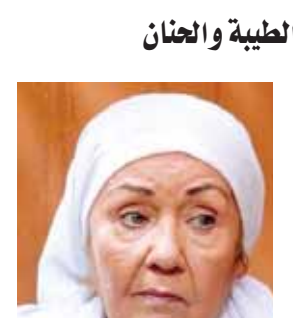
لو التقفه تظهر لكن القسوة أبت ومساحاته لم تتشرب زيت الأمومة والآس ولو فعلت لفاض حباً في لوح القدر لا يستجيب القساة لظهر الأمومة.. لا يتصرفون على أصابع قديمي الأمومة من صغيرها إلى طاهرها..!