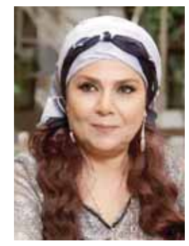
هلا شكننتا مع مناسبة عيد الأم التي يحتفل بها الشعب السوري في الحادي والعشرين من كل عام احتفاء وتكريماً لتضحية الأمهات وخوفهن على أطفالهن وتقانيهن في تحقيق سعادة أطفالهن.