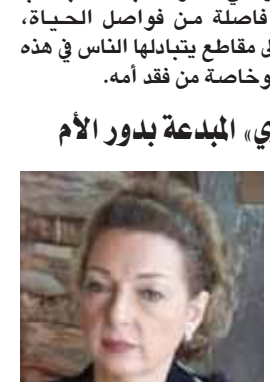
ومررت على أولادها، فأسهمت بتقديم صورة جميلة للأد في حالات القوة والضعف، وأعطت دور الأمومة ما يستحق من الأداء والتعبير في أوقات الرخاء والشدة.