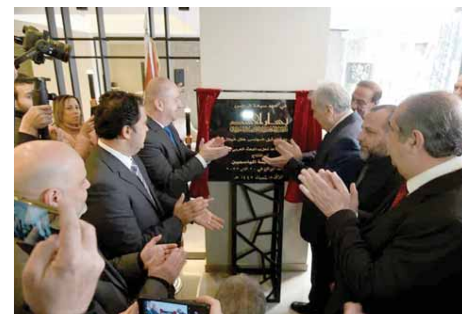
فادي بك الشريف

محافظ دمشق: نذلل الصعوبات ونقدم التسهيلات اللازمة لنجاح المشاريع الاستثمارية