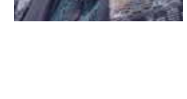
أداء بهير ولا يذهب من الحاضر تلك الأم الحنون التي تتراقص ذقنتها مؤتدة بالبهاء عند كل لحظة السيدة الراحلة نجاح حفيظ التي برعت في تقديم صورة الأم الحانية الباكية، والتي تحوط أبناءها بالحب والرعاية في كل فاصلة من فواصل الحياة، وتحولت دعواتها إلى مقاطع يتبادلها الناس في هذه المناسبة العظيمة، وخاصة من فقد أمه.

جداً وهادئاً ومتمزن، وذلك من خلال تأديتها لشخصية «أم عمر» في مسلسل «أحلام كبيرة»، وهي الزوجة الأم التي تخاف على أولادها وتتمنى لهم النجاح والفرح في حياتهم، ما جعل المتابع يتعلق بهذه الشخصية كونها تشبه الأم السورية البسيطة والطيبة.