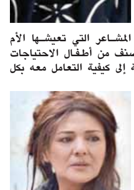
وقد أثبتت الفنانة السورية قدرتها الفائقة على تصوير دور الأمومة، بل إن كثيراً من المتابعين يسألون: إن كان هذا الممثل أيتها أم لا من كثرة الإلتقان، ولأن فنون الأداء في متواها الأعلى فقد قدمت الفنانة السورية الأم في أبهى صورها، وفي حدا لاتها سوا كانت الفنانة أما أم لم تكن على الحقيقة في الحياة الطبيعية.. وفي مناسبة عيد الأم نسترجع بعض الشخصيات التي قدمت دور الأمومة وتركت أثراً.