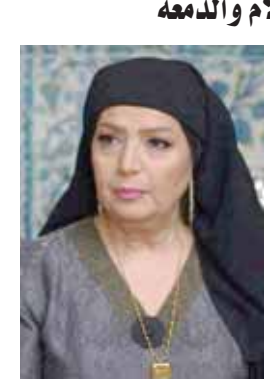
نقف مع ظاهرة الأمومة في الدراما السورية ونخش الفئانات المبدعات اللواتي أدنين دور الأم، ولم تتردد الفنانة السورية، حتى الشباب في تقديم دور الأم مبتعدة بذلك عن الأدوار النمطية.