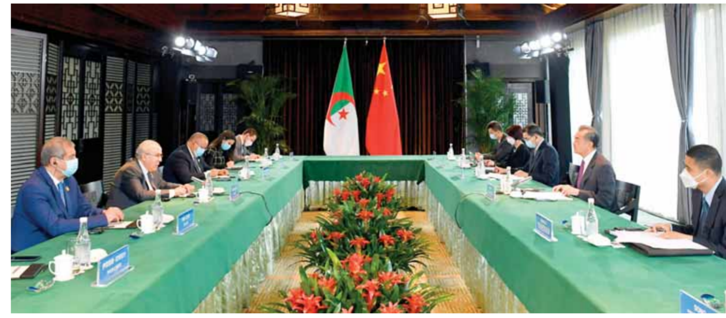
وزير الخارجية الصيني وانغ يي يعلن خلال مباحثاته مع نظيره الجزائري رمطان لعمامرة في الصين أن أزمة أوكرانيا تتطور بطريقة تؤثر فيها على العالم أجمع

المتعاقبة خلال السنوات الإحدى عشرة الماضية، قاسمه المشترك انفصال عن الواقع وتوصيف خاطئ للأحداث وتقديم معلومات مفبركة بهدف تضليل الرأي العام». وأشار صباغ إلى أن إعراب غرينفيلد عن القلق حيال الوضع الإنساني في سورية يتناقض تماماً مع قيام بلاده بفرض إجراءات قسرية غير شرعية على الشعب السوري تسببت بآثار كارثية عليه، مؤكداً أنه من النفاق أن تعرب مندوبة واشنطن عن القلق بشأن «محنة السوريين»، وفي الوقت ذاته تقوم ببلادها بدعم ميليشيات انفصالية إرهابية تسبب بأزمة كبيرة لسكان شمال شرق سورية.