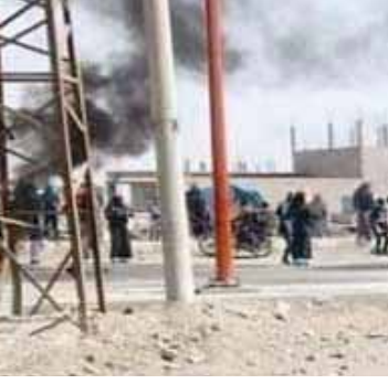
أهالي سويدان ودرنج يبرف دير الزور يتظاهرون ضد ميليشيات «قسد»

افتتاح مركز التسوية في دبي عفتان في ريف الرقة الغربي لتسهيل الحركة على الناس وخاصة أبناء مناطق ريف محافظة الرقة الغربي ومنها منطقة الطبقة والقرى والبلدات المحيطة. ولفت محافظ الرقة إلى أن العراقيل والعقبات التي تضعها ميليشيات «قوات سورية الديمقراطية- قسد» لمنع المواطنين في مناطق سيطرتها من التوجه إلى مراكز التسوية، «لم تعد تشكل هاجساً بسبب الفترة الزمنية الجيدة التي بقيت خلالها مراكز التسوية مفتوحة». وأوضح، أن عملية التسوية في مركز السبخة الذي تم افتتاحه قبل نحو شهرين ونصف الشهر، لا تزال متواصلة، وأن عدداً ممن تمت تسوية أوضاعهم في المركز طوال هذه الفترة وصل إلى ٥٠٠ شخص.