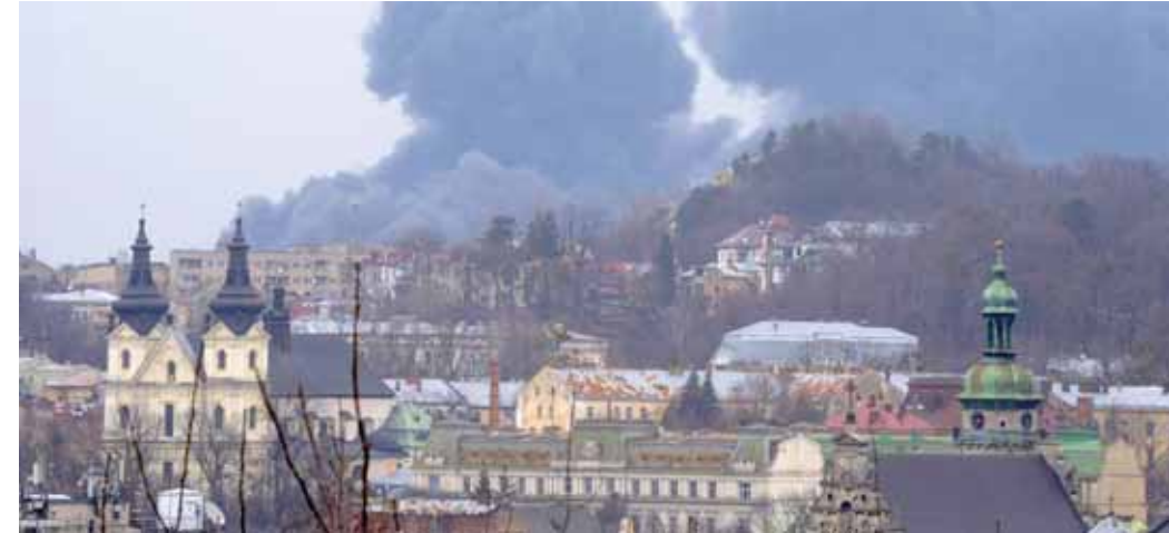
ضربات صاروخية للجيش الروسي بالغة الدقة في محيط مدينة ليف غرب أوكرانيا

في إسطنبول، ونقلت وكالة «تاس» في وقت سابق عن مصدر وصفته بالمطلع قوله: إن وفداً روسيا وأوكرانيا قاما بعمل كاف عن بعد، وحين الوقت الآن لمزامنة الساعات واللقاء وجها لوجه. من جهته أكد سفير الصين في واشنطن تشين قانغ، أن الولايات المتحدة تحاول تهديد الصين لكي تزيد الضغط على روسيا بسبب الوضع في أوكرانيا، لكن هذه التهديدات والضغط لن تنجح. مدياناً، أعلنت وزارة الدفاع الروسية، أمس الأحد، تدمير قاعدة وقود كبيرة ومصنع عسكري، بالقرب من مدينة ليف غرب أوكرانيا، باستخدام أسلحة عالية الدقة. وقال المتحدث باسم الدفاع الروسية إيغور كوشينكوفا: إن القوات الروسية «دمرت بأسلحة جوية بعيدة المدى عالية الدقة، قاعدة وقود كبيرة بالقرب من مدينة ليف، كانت توفر الوقود للقوات الأوكرانية في المناطق الغربية من البلاد، وكذلك في منطقة العاصمة كييف». كما دمرت القوات الروسية بصواريخ ممتحنة عالية الدقة مصنعاً في ليف، كان يقوم بتصنيع وتحديث أنظمة صواريخ مضادة للطائرات من طراز «Tor» و«S-125»، ومحطات رادار للقوات الجوية الأوكرانية، ومعدات للحرب الإلكترونية، وأجهزة تصويب للدبابات.