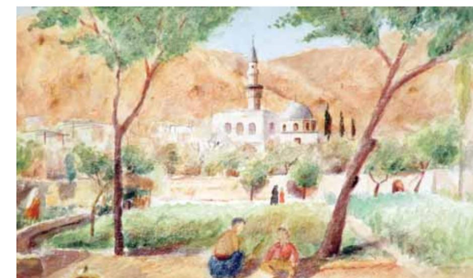
جامع الشيخ محي الدين