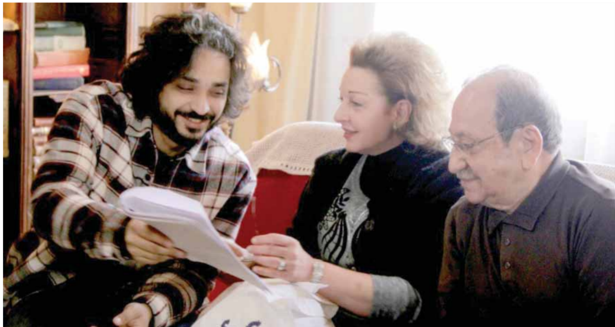
من مسلسل «على قيد الحب»