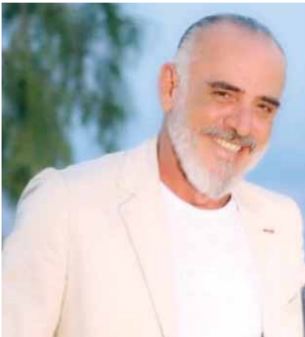
الشاعر بحر لاوديسا