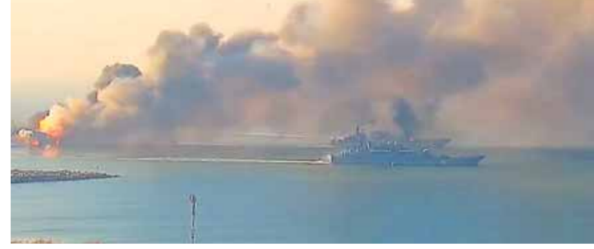
المتطرفون الأوكران يدمرون سفناً في ميناء ماريوبول لاتهم روسيا

الوطن- وكالات صعد الغرب من حربه الدبلوماسية ضد روسيا، حيث استبعدت الدنمارك وإيطاليا وإسبانيا ولافتيا وأستونيا والسويد، عشرات الدبلوماسيين الروس عن أراضيها، لتصف موسكو تلك الخطوات بـ«ضيق البصيرة»، وأن «ذلك سيؤدي حتماً إلى إجراءات انتقامية، وذلك بالتزامن مع تنفيذ الرئيس الروسي، فلاديمير بوتين، بالإجراءات المتخذة في أوروبا ضد شركة الغاز الروسية العملاقة «غازبروم»، محذراً من إجراءات انتقامية محتملة، في غضون أكت دبلوماسية الروسية أن التشكيلات القومية الأوكرانية في ماريوبول رفضت إلقاء أسلحتها والمغادرة عبر المرات الإنسانية، لذلك سيتم تحرير المدينة من قبل القوات الروسية وجمهورية دونيتسك الشعبية. وفي التفاصيل، حذر بوتين من أن التهديدات في أوروبا بتأميم الأصول الروسية «سيف ذو حدين»، وقد تكون هناك إجراءات انتقامية محتملة من جانب روسيا، مضيفاً: إن موسكو ستراقب عن كثب الصادرات الغذائية إلى الدول «العدائية». في غضون ذلك ندد الكرملين أمس بـ«ضيق البصيرة» الأوروبية إثر طرد بلدان في أوروبا أكثر من ١٢٠ دبلوماسياً روسياً على خلفية العملية العسكرية الروسية في أوكرانيا. وقال الناطق باسم الكرملين دميتري بيسكوف في تصريحات إعلامية: «هو أمر مؤسف، فالحد من فرص التواصل على الصعيد الدبلوماسي في هذه الظروف الصعبة»، ينم عن «ضيق بصيرة من شأنه أن يعقد أكثر» العلاقات بين روسيا والاتحاد الأوروبي. بدوره جدد مندوب روسيا الدائم لدى الأمم المتحدة فاسيلي نيبينزيا خلال جلسة مجلس الأمن الدولي