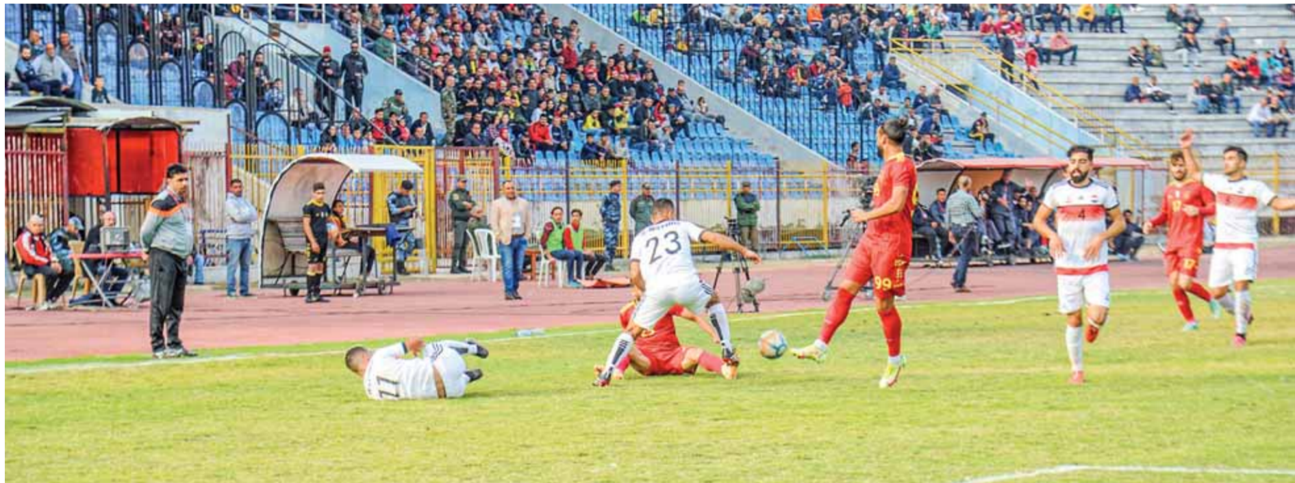
من مباراة الذهاب بين الفريقين

وبدوره حافظ تشرينين على ميزة عدم الخسارة ليكون الاستثناء الوحيد بين كل فرق الدوري.