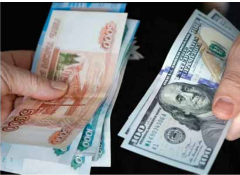
سعر صرف الروبل الروسي يرتفع أمام اليورو والدولار في تعاملات أمس الإثنين