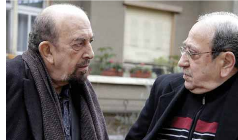
الكبيران دريد لحام وأسامة الروماني