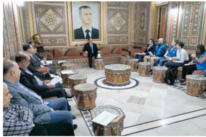
محاظ الحسكة يبحث مع وفد مفوضية اللاجئين التعاون لعودتهم وزيادة الخدمات

يمنع جميع المواد الغذائية وطحين الأفران والوقود اللازمة لتشغيل الأفران الحكومية، ومولدات الأمبيرات الكهربائية الخدمية للمواطنين في منازلهم، نتيجة لعدم استقرار الكهرباء بمحافظة ولغزوف خارجة عن إرادة الدولة، إضافة إلى منع دخول المواد وصهاريج مياه الشرب إلى الخزانات الثابتة في الأحياء وكل ما يخص المواطن من احتجاجات ضرورية وأساسية.