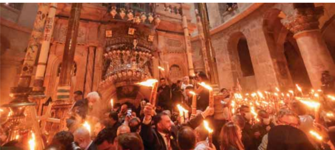
مصلون يحملون شموعاً مضاءة في كنيسة القيامة بالقدس خلال الاحتفال بـ«فيض النور»

في مقدساتهم وأعيادهم، فأبشأ المسيحيون مستهزئين في مقدساتهم وأعيادهم، وحذر من خطورة ما يخطط للأوقاف المسيحية ولأعياد المسيحية، بما في ذلك عيد القيامة، مشيراً إلى وجود تقييدات غير مسبوقة من قوات الاحتلال الإسرائيلي في القدس، وقال: «يجب أن تكون معاً وسواً موحدين في خندق واحد كمعائلة فلسطينية واحدة، لأن وحدتنا هي قوة لنا في دفاعنا عن الحق الذي ننادي به». وكالة «وفا» نقلت عن وزارة الخارجية الفلسطينية مطالبتها الإدارة الأميركية بالضغط على سلطات الاحتلال الإسرائيلي لوقف تغولها على القدس ومقدساتها المسيحية والإسلامية، وإجبارها على التراجع فوراً عن التضييقات والعراقيل التي تضعها في طريق المصلين. وأدانت الوزارة، في بيان لها، أمس السبت، الاعتداءات الوحشية التي ترتكبتها سلطات الاحتلال الإسرائيلي، بحق كنيسة القيامة والمصلين المحققين بسبت النور. كما استنكرت التضييقات التي فرضتها سلطات الاحتلال لمنع وصول أعداد كبيرة منهم للصلاة بالكنيسة. وأعتبرت أن هذه الاعتداءات استخفافاً بمشاعر المسيحيين وتدنيساً لمقدساتهم، وتفرغاً للكراهية والحقد والعنصرية ببعديها القومي والديني وجيش الاحتلال وتقلباتها في المستوى السياسي، وهي جزء لا يتجزأ من عمليات أسلحة وتهويد القدس ومقدساتها، خاصة المسجد الأقصى المبارك.