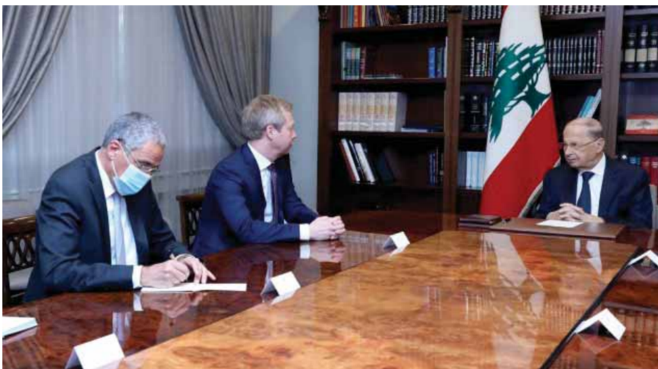
الرئيس اللبناني ميشال عون خلال لقائه أمس الممثل الخاص للاتحاد الأوروبي لعملية السلام في الشرق الأوسط