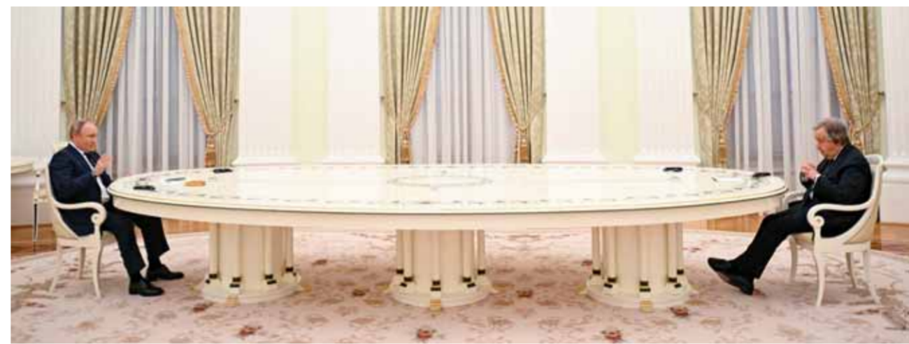
الرئيس الروسي فلاديمير بوتين خلال لقائه الأمين العام للأمم المتحدة أنطونيو غوتيريش في موسكو أمس (أ ف ب)

«نعمل على إمكانية حل الأزمة مع أوكرانيا عبر المسار الدبلوماسي». وتابع: «لا يمكن عقد اجتماع مع (الرئيس الأوكراني فولوديمير زيلينسكي) من دون التوافق على القضايا الفرعية، وسلطات كيف لم تطبق اتفاقات مينسك ولم تمنع وقوع إبادة جماعية في دونباس». وتوجه بوتين بالقول إلى غوتيريش: «أنتم تقولون إن المعرات الإنسانية الروسية لا تعمل، السيد الأمين العام، لقد تم تضليلكم، فهذه المعرات تعمل، ١٣٠-١٤٠ ألف شخص غادروا ماريوبول بمساعدة روسيا ويمتلكهم الذهاب إلى أي مكان، بعضهم إلى روسيا، وبعضهم إلى أوكرانيا، يمكنهم الذهاب إلى أي مكان، نحن لا نمنعهم نحن نقدم كل أنواع المساعدة والدعم لهم». وتابع: «نعم، نسمع من السلطات الأوكرانية عن وجود مدنيين في آزوفستال، ويتعين على جنود الجيش الأوكراني إطلاق سراحهم، أو أنهم يتصرفون بالإرهابيين في العديد من دول العالم، مثل تنظيم داعش الإرهابي في سورية الذي اختبأ وراء المدنيين»، مضيفاً: «أسهل شيء يمكن فعله