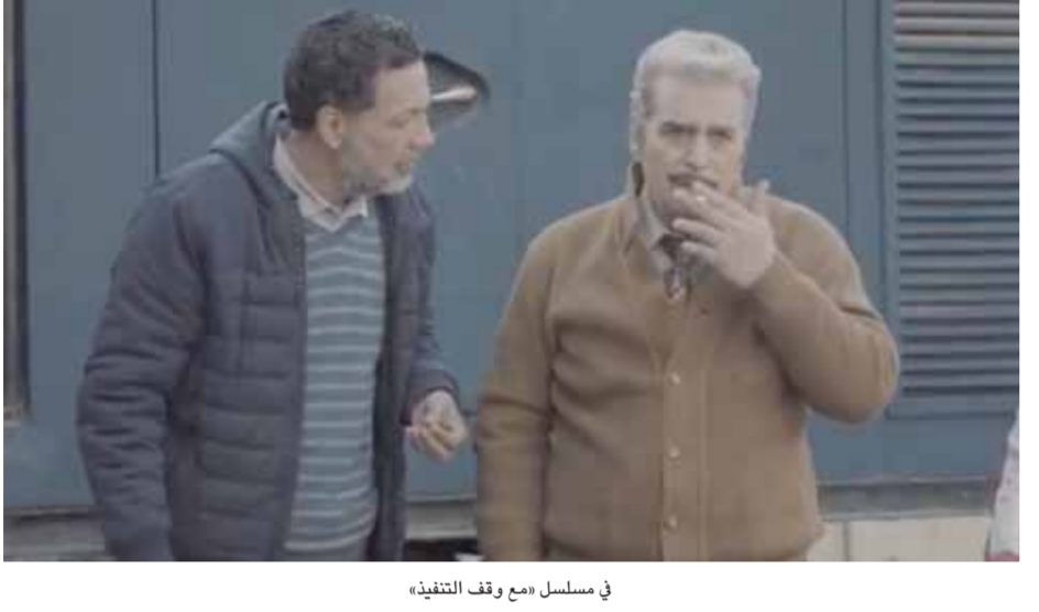
في مسلسل «مع وقف التنفيذ»

الدرامية وتستطيع أن تقول إنه شيخ الكار وأستاذ خبير يتلون عند كل مشهد ويطلق العنان لنفسه حتى تتوحّد مع الأدوار.