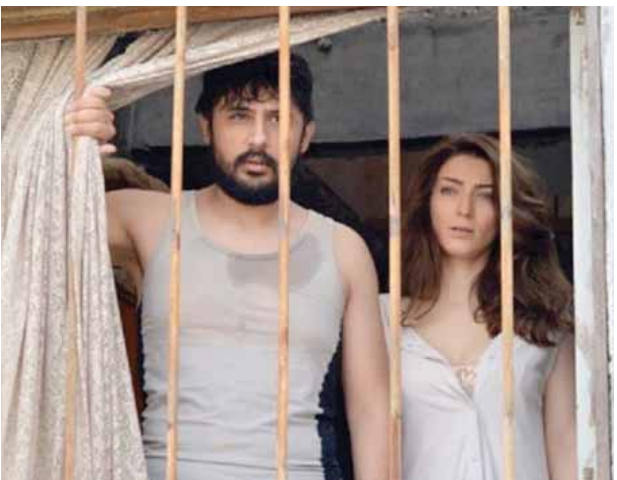
من فيلم «غيوم داكنة» أيمن زيدان