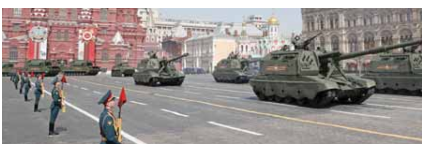
من برفات الاحتفال بيوم النصر في الساحة الحمراء في موسكو (عن الانترنت)

برلين لن تتخذ أي قرارات من شأنها أن تجعل حلف «الناتو» طرفاً في الأزمة بين روسيا وأوكرانيا، كشف نائب رئيس الوزراء البلغاري، وزير المالية أسن فاسيليف، أن صوفيا طالبت المفوضية الأوروبية بتأجيل حظر إمدادات النفط الروسية، مشيراً إلى حق بلاده في نقض هذا القرار، وقال فاسيليف، في مقابلة تلفزيونية: «نريد أن تكون من بين الدول التي ستمنح إعفاء مؤقتاً من حظر النفط الروسي، وإن لم تحصل على الإعفاء، فلن ندعم العقوبات». والعمليات القانونية لكل شريك، زاعماً أن «الرئيس الروسي فلاديمير بوتين جعل بلاده دولة منبذة على الصعيد الدولي». وسبب قرارات بلدان أخرى في مجال الطاقة، بأن