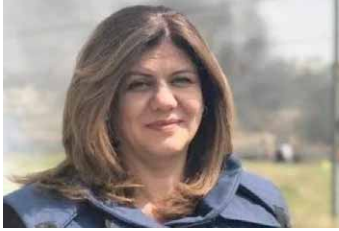
الشهيدة الصحفية شيرين أبو عاقلة

أمن الصفي، بأنها جريمة بشعة، وعلى حين اعتبر الرئيس اللبناني ميشال عون بأن هذا الاغتيال الوحشي يضرب عرض الحائط بكل المواثيق والقوانين الدولية، طالب المتحدث باسم وزارة الخارجية الإيرانية، سعيد خطيب زاده، المنظمات الدولية بإجراء تحقيق مستقل، كما اعتبرت الخارجية الكويتية اغتيال الإعلامية بأنه جريمة نكراء تتحمل سلطات الاحتلال مسؤوليتها كاملة. وندد البيت الأبيض، باستشهاد أبو عاقلة، ودعا إلى فتح تحقيق في وقتها، كما وقف مجلس النواب الأمريكي، بدقة صمت حاداً على روحها، وكذلك ندد الاتحاد الأوروبي بالجريمة وطالب بتحقيق مستقل حول ملابسات ما جرى.