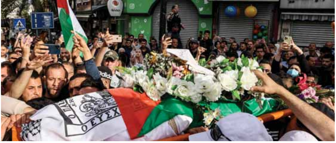
من تشييع الصحفية الفلسطينية شيرين أبو عاقلة التي اغتالها قوات الاحتلال الإسرائيلية أمس

هذا الاستهداف ليس بجديد على الاحتلال الإسرائيلي الذي يواصل ارتكاب الجرائم وسط دعم الغرب المستمر له، في ظل صمت دولي مريب عن ممارساته وانتهاكاته الجسيمة بحق الشعب الفلسطيني وبحق أهله في الجولان العربي السوري المحتل وشعوب المنطقة، وقال: «إننا على ثقة بأن زملاءنا في الأراضي المحتلة سيتابعون التزامهم بقضيتهم والدفاع عنها، مهما ارتكب هذا الكيان من جرائم مؤكداً دعمه التام للإجراءات التي تتخذها نقابة الصحفيين الفلسطينيين لحاسبة الجناة ووقوفه معها بخندق واحد في مواجهة الإرهاب بأشكاله كافة». ودعا الاتحاد الهيئات والمنظمات والنقابات