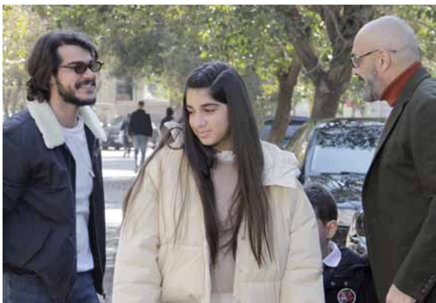
من مسلسل «على قيد الحب»