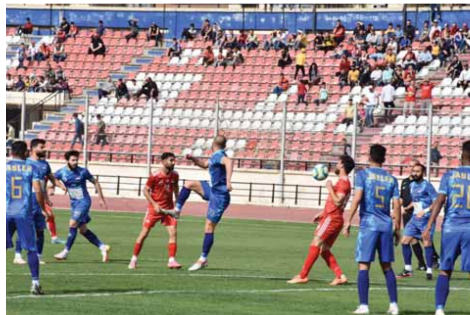
من مباريات جبله في الدوري