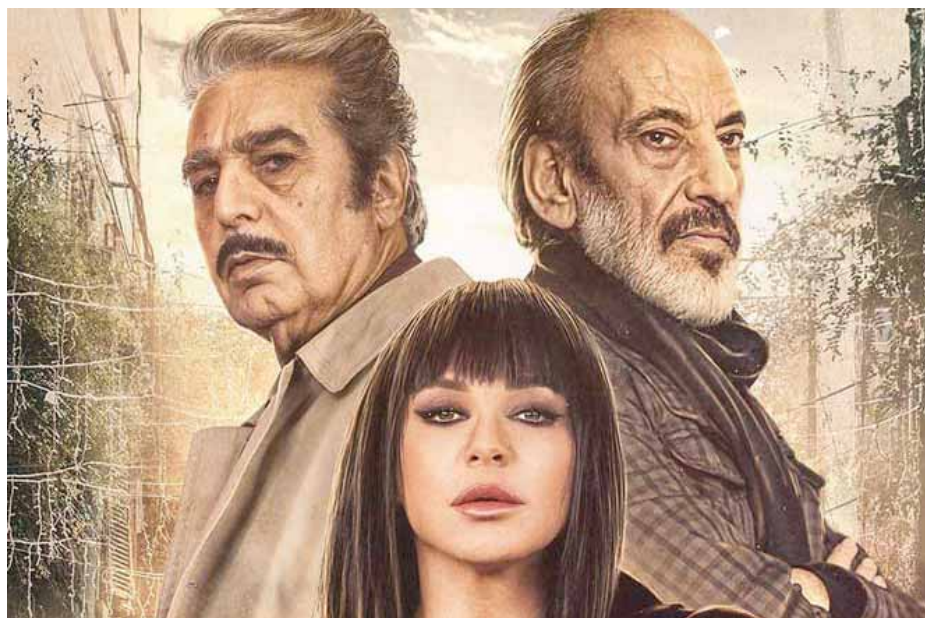
من مسلسل «مع وقف التنفيذ»