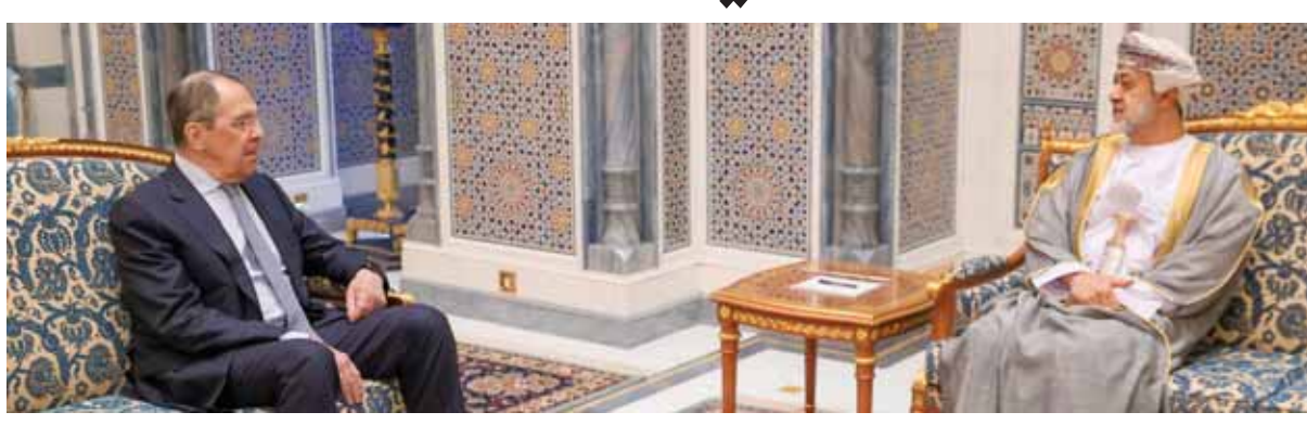
السلطان العماني هيثم بن طارق خلال استقباله وزير خارجية روسيا سيرغي لافروف في العاصمة مسقط أمس (أ ف ب)

المواطن وعلى العكس من ذلك، تقوم واشنطن بإطالة أمد العمليات العسكرية على أراضي أوكرانيا، وبهذا السبيل لا يمكن لسكانها العودة إلى حياتهم السلمية المعتادة». ومع الإعلان عن عقد جلسة لمجلس الأمن الدولي في ١٧ أيار، أعلنت الولايات المتحدة أنها زودت سلطات كييف بالأسلحة قبل وقت طويل من بدء العملية الروسية الخاصة، وأنها بدأت بتزويدها بالذخيرة الثانية من مروحيات «مي ١٧». وفي السياق قال المتحدث باسم المتناغون جون كيربي، على قناة «فوكس نيوز»: إن الولايات المتحدة زودت أوكرانيا بالأسلحة قبل وقت طويل من بدء العملية الروسية الخاصة، وأضاف: «قامت إدارة الرئيس الأميركي جو بايدين بتزويد