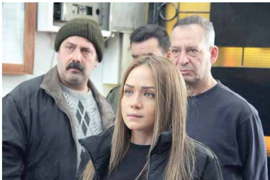
من مسلسل «كسر عضم»

ما مر على سورية بكل تأكيد هو حدث مفصلي استمر إلى ظروف الانتقاسات السياسية، والصعوبات