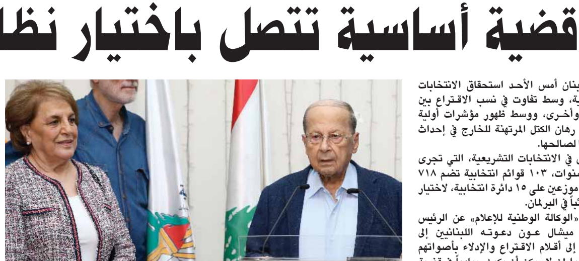
الرئيس اللبناني ميشال عون يترأس البعثات للإقراع بعد البصولة في خارة حريك ببيروت (عن الانترن٢)

انجز لبنان أمس الأحد استحقاق الانتخابات التشريعية وسط طقوس في نسب الإقراع بين دائرة وآخرى، وسط تظهور مؤشرات ألبية تعاكس بين طاقات القوى المعارضة وإحداث خرق ما صالحها.