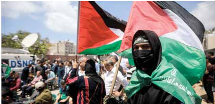
فلسطينيون خلال مشاركتهم في فعاليات ذكرى النكبة في غزة