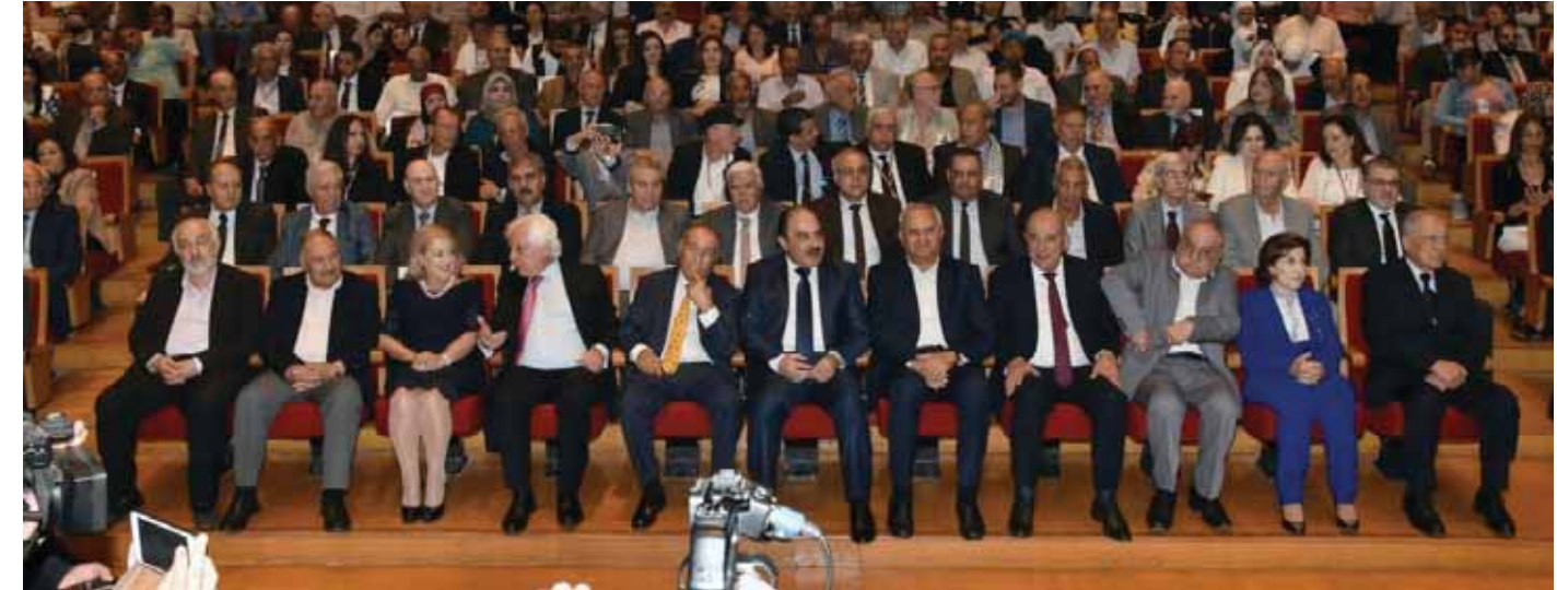
جانب من الحضور الرسمي السوري والفلسطيني خلال افتتاح أعمال المؤتمر الخامس لاتحاد الجاليات والفعاليات والمؤسسات الفلسطينية في الشتات - أوروبا