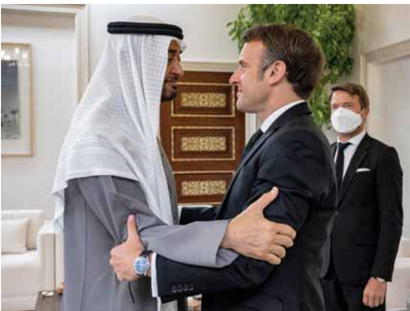
الرئيس الفرنسي خلال تقديمه واجب العزاء للشهيد محمد بن زايد آل نهيان

في العديد من أقلام الإقراع في حين ساد الحال شديد في أماكن أخرى، كما سجلت بعض الشكاوى حول مشاكل لوجستية وتنظيمية أو بقاء في عملية الانتخاب.