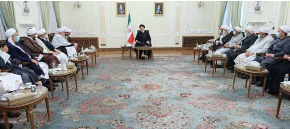
الرئيس الإيراني إبراهيم رئيسي خلال لقائه أمس مع حشد من علماء ورجال الدين

حذر الرئيس الإيراني إبراهيم رئيسي من تغلغل الأفكار التكفيرية والسلفية في البلاد، مؤكداً أن الحركات الخارجية لإدارة الفتنة والفرقة الإيرانية أن طهران جادة في عدلته الخارجية لإحياء الاتفاق النووي التي تقضي إل إلغاء الحظر والوفاء بالالتزامات الدولية، كما تكف بمجزم في عدم الاعتماد على الأجانب لتحقيق مآربها.