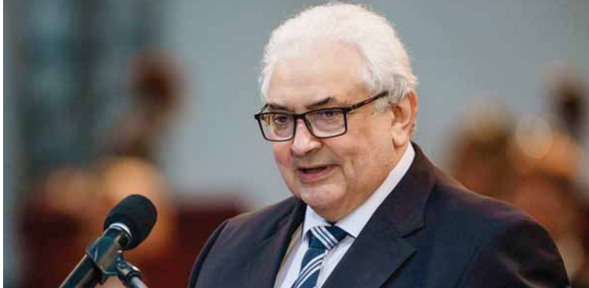
سفيرا روسيا لدى ألمانيا سبرغي تيشيايف (عن الانترن٢)