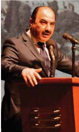
الأمين العام المساعد لحزب البعث هلال الهلال

وتتخلل حفل الافتتاح عرض فيلم وثائقي عن تأسيس اتحاد الجاليات والفعاليات والمؤسسات الفلسطينية في الشتات - أوروبا ومؤتمراته المنعقدة سابقاً. حضر الجلسة الافتتاحية المستشارة الخاصة في رئاسة الجمهورية بثينة شعبان ووزيرة الثقافة لباتية مشوح ورئيس اللجنة الشعبية العربية لدعم الشعب الفلسطيني ومقاومة المشروع الصهيوني صابر فحوق ومدير عام مؤسسة القدس الدولية - سورية أساقفة سبسطية وعدد من أعضاء القيادة المركزية لحزب البعث العربي الاشتراكي ومن السفراء والبعثات الدبلوماسية المعتمدة بدمشق ومن القيادة القطرية الفلسطينية لحزب البعث العربي الاشتراكي ومن قادة وممثلي الفصائل الفلسطينية والأحزاب الوطنية السورية والفلسطينية وفعاليات اجتماعية وثقافية.