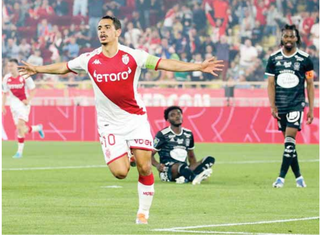
وسام بن بيدر بطل فوز موناكو

في رين نجح صاحب الأرض في إيقاف مرسلينا وهزيمه بهدي بنيامين بورجيايد ولوقرو ماجر ليتعش حفظه بطاقة الشامبيونزليغ بعدما رفع وصده إلى ٦٥ نقطة وفارق أهداف بلغ ٤١ هدفاً علماً أنه في ثماني جولات دون فوز وهي الأثقل في سجله هذا الموسم، وسجل زميله دي ماريا الهدف الثالث وتكفل كلين ميايبي بالرابع من علامة الجزاء معززاً صدارته للهدافين مسجلاً هدفة رقم ٣٧.