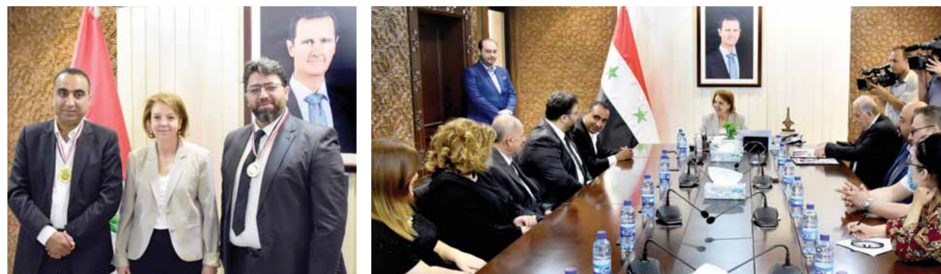
وزيرة الثقافة تتوسط الفائزين بالجائزة التشجيعية