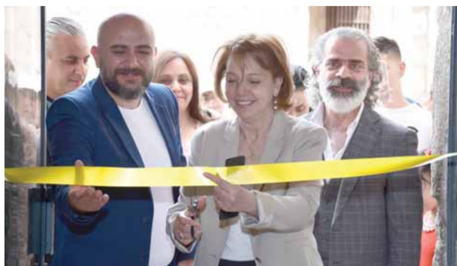
سارة سلامة

بمشاركة ٤٠ فناناً أفتحت وزيرة الثقافة الدكتورة لبناء مشوّح معرض الربيع السنوي ٢٠٢٢ الذي يقيمه مديرية الفنون الجميلة بالتعاون مع اتحاد الفنانين التشكيليين في خان أسعد باشا بدمشق. ويتضمن المعرض حوالي ٤٠ عملاً من مختلف المجالات الإبداعية البصرية من تصوير ونحت وخزف وجرافيك إضافة إلى المشاريع التجريبية «فيديو آرت» ومشاريع تركيبية، وذلك في «قاعة العرش» بقلعة دمشق للمرة الأولى هذا المكان العريق الذي أضفى حميمية أكثر على اللوحات، التي تميزت بتنوعها بين التصوير الزيتي والنحت، وركزت هذا العام على النوع والجودة والتميز لا العدد، حيث حملت روح شباب كثر خريجين يعرضوا أعمالهم وتشكل بوابة وبارقة أمل نحو مستقبلهم، في مكان يضفي الحميمية ويحمل الطابع الدمشقي لم يخل من العطاء على مر تاريخه تزهو قلعة دمشق اليوم بفنانيها الشباب تقدمهم خطوة نحو المستقبل لينطلقوا بعدها ببناء أنفسهم. مشاركات متنوعة ومشاريع تخرج عرضها الشباب في القاعة التي تعج بالزوار وتحديثاً إلى بعضهم وتلقفنا مشاعرهم وطموحهم وحمية عملهم.