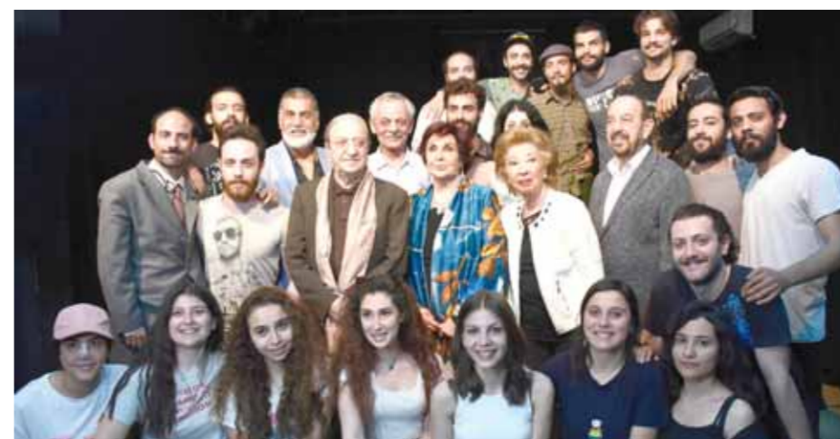
... وبرفقة الفنانين الكبارين دريد لحام وأسماء الروماني مع طلاب السنة الرابعة وأستاذهم النجم فايز قزقي