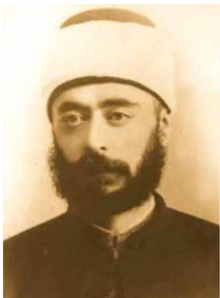
عبد الرحمن الكواكبي