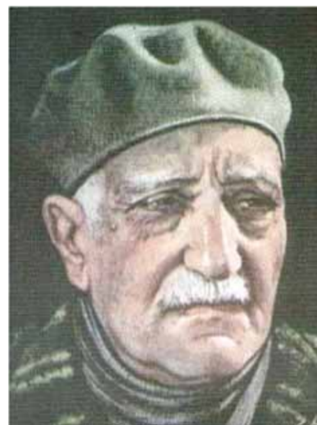
عباس محمود العقاد

لعل شخصية السلطان عبد الحميد آخر السلاطين العثمانيين هي من أكثر الشخصيات المتنازعة في العصر الحديث، وذلك يرتبط بأمر عدة لعل أهمها: حركة التحرر العربي التي أرادت التخلص من الاحتلال مهما كان نوعه، ومهما كان تصنيفه، والرابط الديني والعاطفي الذي عملت عليه الدولة العثمانية وأكثر من عزف عليه السلطان نفسه، ومنها استعانة السلطان بعدد من رجال الدين العرب والمسلمين الذين أسهموا في تميع الصورة الحقيقية أو القريبة من الواقع، وربما كان أهم الأسباب متمثلاً في الجانب العاطفي المرتبط بزعر الكيان الصهيوني في المرحلة نفسها، والروايات المتضاربة التي شيطنت السلطان أو جعلته ملاكاً حريصاً على عروبة فلسطين أكثر من العرب أنفسهم! وقد أسهم في غياب الرؤية والتقوم غياب النقاد المنطقيين البعيدين عن العاطفة العداوية أو العاطفة غير المنطقية بحال من الأحوال، فماداً كان السلطان عبد الحميد؟