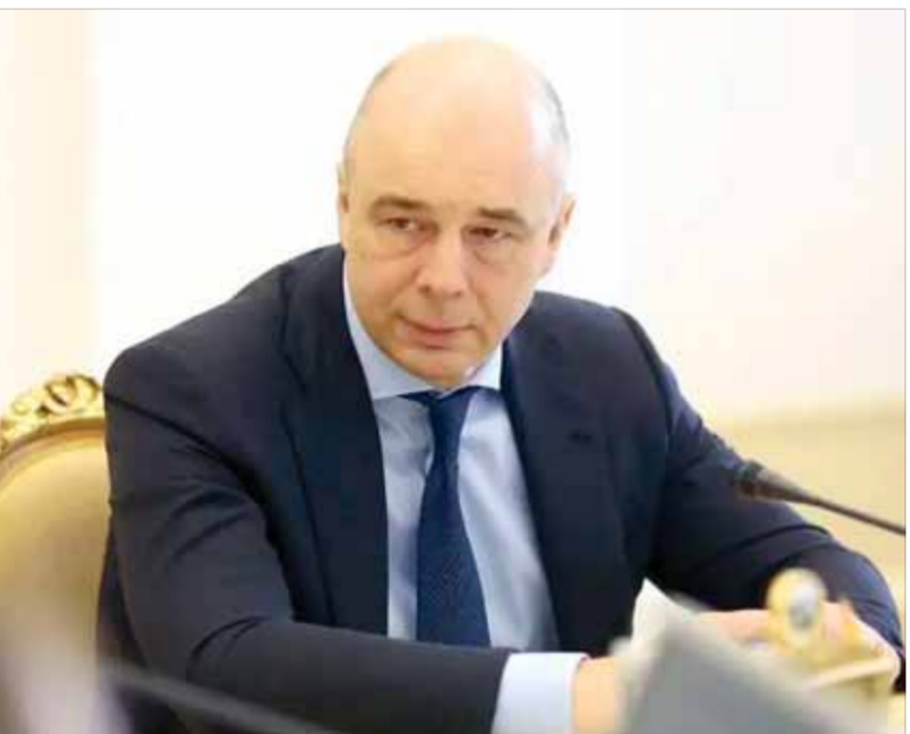
وزير المالية الروسي أنطون سيلوانوف

العقوبات الغربية، قائلاً: إنه تم تجاوز الصدمة الأولى من العقوبات التي فرضت على اقتصاد البلاد. ولفت سيلوانوف إلى أن روسيا لا تعترض التخلف عن سداد الدين العام، مبيناً أنه في حال تم إغلاق المؤسسات الغربية فإن روسيا ستكون قادرة على سداد الديون بالروبل الروسي. وأكد سيلوانوف أن الاقتصاد الروسي لن يفلق أو يتم عزله، وقال: إن العولمة في السياسة المالية والمتعلقة بالميزانية، تسجل من الممكن تحمل أشد العقوبات التي ستعبر على روسيا أن توجهها.