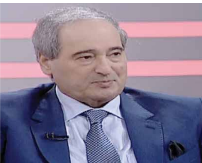
وزير الخارجية والمغتربين فيصل المقداد (عن الانترنت)

مباشر مع الجانب التركي قبل استيحاء عدة أمور وأولها يجب أن يكون هناك انسحاب تركي كامل من سورية أو استعداد تركي للانسحاب أو تحقيق انسحاب جزئي قبل الحوار، والأمر الثاني هو وقف دعم تركيا للمجموعات الإرهابية المسلحة، وثالثاً أن تقوم تركيا بوقف محاولاتها الإنسانية بوقف دفع مبالغ نهر الفرات. وشدد المقداد على أن كل الضربات التي تعرضت لها سورية من قبل إسرائيل، جرى الرد عليها، ويمكن الاستدلال على ذلك بما يجري داخل الأراضي المحتلة، ولا يمكن الحديث عن طبيعة هذه الردود لكن سورية ترد بشكل مباشر أو غير مباشر.