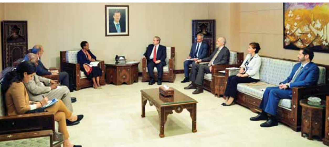
وزير الخارجية والمغتربين فيصل المقداد يستقبل مساعدة الأمين العام للأمم المتحدة للشؤون الإنسانية جويس ميسويا والوفد المرافق لها أمس (سانا)

الطبيعية وإلى منازلهم وأعمالهم بعد إلغاء كل الإجراءات القضائية والقانونية الاحترازية أو العقابية التي كانت صادرة بحقهم. وأشار المقداد في الرسالة إلى أن الوزارة قد طلبت من كل البعثات الدبلوماسية والقنصليات السورية في الخارج استقبال جميع المواطنين السوريين المغتربين الراغبين بالاستفادة من مراسيم العفو العام كافة بما فيها مرسوم العفو الأخير الخاص بالجرائم الإرهابية. وشرح وزير الخارجية والمغتربين لنظرائه العقبات المصطنعة التي لا تزال تعترض طريق سورية في مجالات تحقيق الاستقرار الاقتصادي والاجتماعي وفي مقدمتها الوجود العسكري الأجنبي غير الشرعي للقوات التركية والأميركية وقوات ما يسمى «التحالف الدولي» وسيطرة الميليشيات الانفصالية التابعة للولايات المتحدة الأمريكية على حقول النفط والغاز وعلى الأراضي الزراعية المهمة التي تشكل الخزان الغذائي الأساسي للشعب السوري وكذلك الإجراءات القسرية أحادية الجانب الدمرة المفروضة على الشعب السوري التي تعوق إطلاق عملية التعافي المبكر وإنعاش الاقتصاد السوري وعودة اللاجئين والنازحين إلى مناطقهم. وفي ختام رسالته، دعا المقداد الأمم المتحدة ودول العالم إلى دراسة ما يتم تحقيقه في سورية بشكل عميق ومستوازن وإلى التعاون مع الدولة السورية ودعم جهودها في تطوير مقاربة سياسية إيجابية وبناءة ومنتجة في التعامل مع الوضع في سورية، مؤكداً أن اللحظة قد باتت حاسمة للعمل مباشرة وبشكل مسؤول وجدي ونزيه مع الحكومة السورية وبمأنى عن أي اعتبارات مسبقة لا تأخذ المصلحة الوطنية السورية وآفاق تحقيق الأمن والاستقرار والرفاه للشعب السوري وجهود مكافحة الإرهاب بعين الاعتبار.