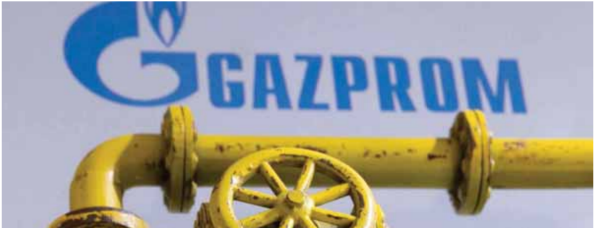
شركة «غازبروم»، توقف بدءاً من اليوم عمليات التسليم إلى «شل إنرجي أوروبا» في ألمانيا وإلى «أورستيد» الدنماركية (عن الانترنت)

ضرورية. واستمرت بوابست للموافقة على هذه العقوبات حصولها على ضمانات في مجال أمنها الطاقوي، لأنها دولة حبيسة، وتعتمد بسبب عدم وجود أي ميناء بحري لديها، على خط أنابيب «دروجبا» لاستيراد النفط الروسي. وتسارع التضخم السنوي في منطقة اليورو، التي تضم ١٩ دولة، ووفقاً للتقديرات الأولية، وصل في أيار ٢٠٢٢ إلى رقم قياسي، عند مستوى ٨,١ بالمئة.