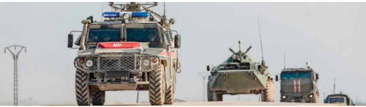
دورية عسكرية روسية تقوم بجولة اعتيادية في منطقة تل تمر بريف الحسكة

بلدات الحوشية وأم حوش وأم القرى وعقيبة وشعلة وزويان النصب الأكبر من القصف الهجومي، ما دفع من تبقي من السكان للزوح باتجاه مدينة تل رفعت ومحيطها، حسب قول مصادر محلية في تل رفعت لـالوطن. من جهة ثانية بين مصدر ميداني لـالوطن، أن وحدات الجيش العامة، بريف حماة الشمالي، دكت برميات مدفعية وصاروخية، مواقع ميليشيات «جبهة التحرير» الموالية للاحتلال التركي في محاور بسبل الغاب الشمالي الغربي، وبرشقات رشاشة في محور قلابين، تزامناً مع مد وحدات الجيش العاملة بريف إدلب بالمدفعية والصواريخ أيضاً نقاط تمرکز للإرهابيين في منطقة جبل الزاوية بريف إدلب الجنوبي.