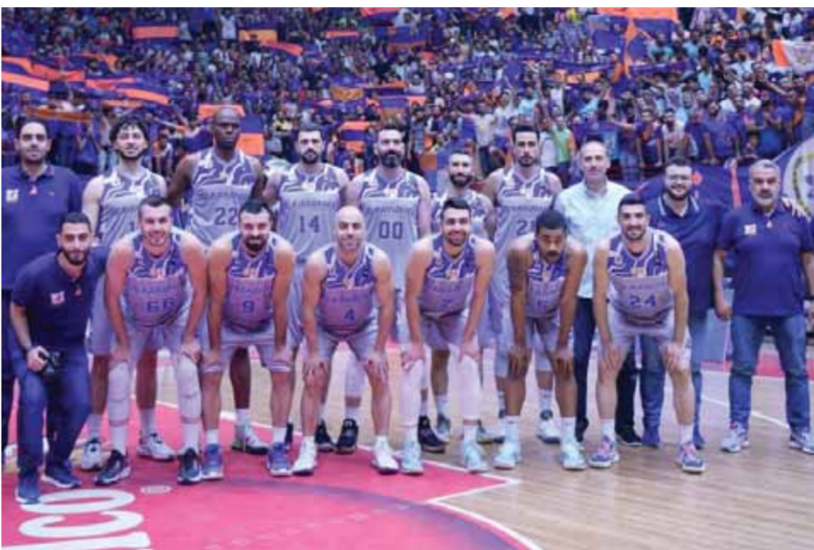
بلوك -- التسجيل: ٢٣ نقطة..

على الجهة الثانية كان قبيل المنافسة بين فريقين الوحدة والكرامة قد وصل ليهيب إلى درجة الغليان بعد خمسة لقاءات كانت مفعمة بكل ما لذ وطاب من الفئلات الجميلة واللحقات المهارية المتجددة وكان للحضور الجماهيري الدور الأهم في إضفاء هذه اللقاءات جمالية عالية المستوى. لقاءات الفريقين اتسمت بالقوة وكان التوقع بفوز هذا الفريق أو ذاك أشبه بضرب من ضروب المستحيل نظراً لما يملكه الفريقان من لاعبين مؤثرين ومهمن ومهرة. ليتعادل الفريقان في الفوز والخسارة ووصلوا إلى اللقاء الفاصل والحاسم الذي جمعهما مساء يوم الجمعة