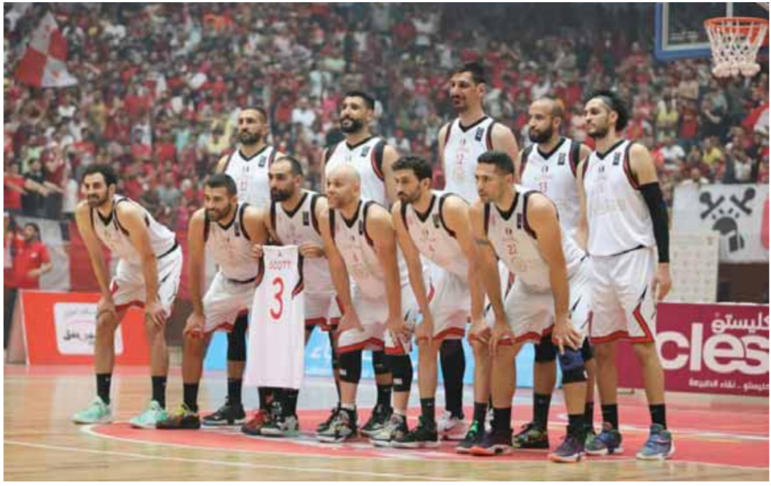
النهاية الأهلي استحق التأهل على حساب جاره الجلاء.