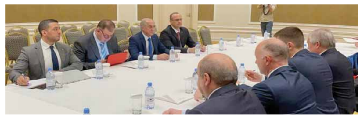
اجتماع بين الوفدين السوري والروسي خلال المؤتمر الدولي الثامن عشر حول سورية بموجب صيغة أستانا في العاصمة الكازاخية

وحول تبة النظام التركي شن عدوان جديد على الأراضي السورية، قال لافرنيتيف: إن «احتمال قيام تركيا بعملية عسكرية في الشمال السوري سيكون غير منطقي وغير عقلائي وذلك سيقود إلى تصعيد التوتر وإلى شوط جديد للجبهة العسكرية في تلك المناطق». إن «روسيا لن ترضى الطرف عن العملية العسكرية التركية الجديدة في شمال سورية مقابل موقف أقره من انضمام فلندا والسويد للناتو، شددنا على أن بلاده «لا تتخلى عن حلفائها في المنطقة».