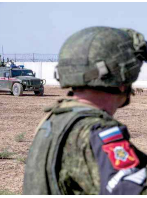
دورية مشتركة روسية - تركية في عين العرب (عن الانترنت - أرشيف)

وأكوسك وتبري وقباجب وتل حاجب وجيشان وخرايسان فوقان. بالمقابل واصل الاحتلال التركي ومرتزقته استفادهم المدفعي وبقدائف الهاون لقرى وبلدات ريف حلب الشمالي الأوسط المههد بالغزو، حيث طال القصف كلاً من بلدات دير الجمال والزيارة والوحشية وكشتار وأبين وتل عجار والشيخ عيسى، مخلفاً أضراراً بالغة في ممتلكات المدنيين على الرغم من أن مروحيات روسية حلقت فوق خطوط تماس المنطقة في الليلة ما قبل الماضية، وفق قول مصادر أهلية في ريف حلب الشمالي الأوسط لـ«الوطن». أما في منبج، وحسب مصادر «الوطن»، فبقي حال التصعيد من الاحتلال التركي ومرتزقته على حاله إذ جرى استهداف محيط بلدة العريمة جنوب غرب منبج وخطوط تماس نهر الساجور غرب المنطقة، إلى جانب قرى الكاوكلي وقرط ويران ومزارع الفوارس، الأمر الذي فرض موجة نزوح جديدة لدى قاطني تلك القرى باتجاه مدينة منبج الواقعة تحت هيمنة «قسد». كما أكدت مصادر محلية، أن قوات الاحتلال التركي ومرتزقتها اعتدت بقذائف المدفعية الثقيلة والصاروخية على المناطق السكنية في قرية الهوشان والطريق الدولي «إم ٤»، ومحيط بلدة عين عيسى بريف الرقة الشمالي، بالتزامن مع تحليق مكث للطيران الحربي التركي في أجواء المنطقة، حسب ما ذكرت وكالة «سانا». وأشارت المصادر، إلى أن الاعتداءات، أسفرت عن وقوع أضرار مادية بالمتارز والممتلكات من دون ورود جرحى أو مصابين في صفوف المدنيين الذين اضطروا للاختباء بالأقبية خوفاً من هجمة الاحتلال التركي والقصف العشوائي.