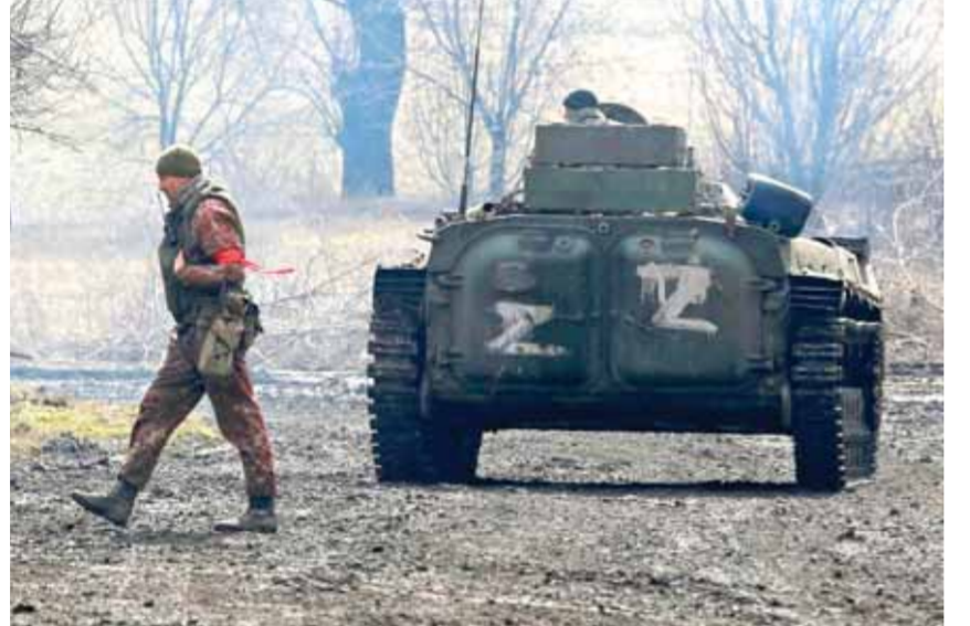
قوات ردية للجيش الروسي في منطقة سفياتوغورسك في محيط جمهورية دونيتسك

حذرت موسكو على لسان وزير خارجيتها سيرغي لافروف من أن استمرار الغرب بتزويد أوكرانيا بالأسلحة، سيؤدي إلى توسيع رقعة العملية العسكرية الروسية فيها. وأوضح لافروف خلال مؤتمر صحفي في موسكو أمس، أن الغرب وقف صامتاً أمام خطر اللقعة الروسية في أوكرانيا واعتداءات النازيين الجدد على أهالي إقليم دونباس طوال ثنائي سنوات، وتجاهل مبادرة الضمانات الأمنية التي قدمتها روسيا ولم يترك خياراً آخر سوى العملية العسكرية الخاصة في أوكرانيا. ولفت لافروف إلى أن توسع حلف شمال الأطلسي «ناتو»، شرقاً ينتهك الالتزامات القانونية وأن انضمام السويد وفنلندا إلى الحلف لن يحسن الأوضاع من الناحية السياسية، مبيناً أن روسيا لن تسمح بأي تهديد لأمنها. وأشار لافروف إلى عدم وجود خطط لدى روسيا حالياً للحديث مع دول الناتو أو زيارتها خلال الفترة المقبلة. وفيما يتعلق بمنع دول في الناتو طائرتهم من العبور إلى صربيا قال لافروف: «إن هذه الخطوة غير مسبوقة وإن الغرب يرسل إشارة واضحة لروسيا بأنه لن يتورع عن أي وسيلة من أجل منادوب روسيا الدائم لدى الأمم المتحدة، فاسلبي نيبينزيا، أكد بدوره أن لدى روسيا الحق في ضرب المراكز صنع القرار التي حولت استخدام راجعات الصواريخ بعيدة المدى. وقال نيبينزيا في اجتماع لمجلس الأمن أمس: «لا تحتفظ فقط بحقنا في إبعاد تهديد النازيين عن روسيا وجمهوريتي دونباس إلى مسافة تساوي مسافة تلك المراكز لصواريخ الجديدة، ولكن أيضاً لضرب مراكز اتخاذ القرارات الإجرامية باستخدام مثل هذه الأنواع من