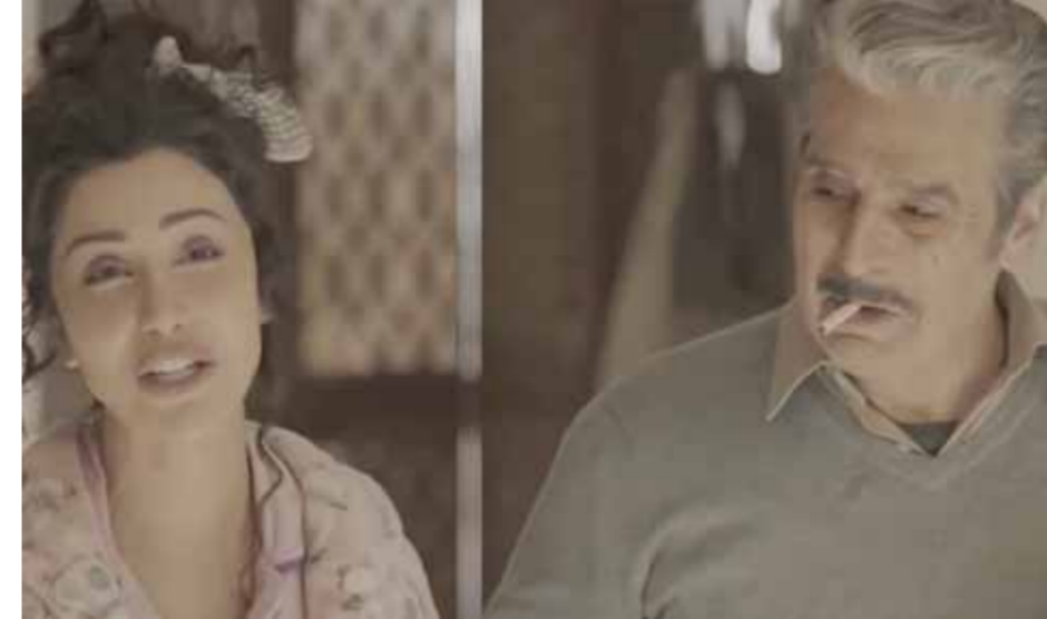
عباس النوري وحلا رجب في مسلسل «مع وقف التنفيذ»