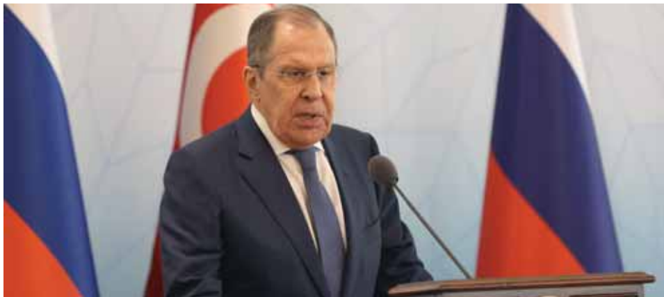
وزير الخارجية الروسي سيرغي لافروف خلال زيارته أنقرة أمس

وفقاً للتوقعات، خرج الاجتماع الروسي - التركي الذي جمع وزير خارجية البلدين سيرغي لافروف ومولود جاويش أوغلو في أنقرة أمس، بتأكيدات جديدة على مضي الطرفين بتنفيذ الاتفاقيات الموقعة بما يخص الملف السوري والاتزام بالأهداف المخصوص عليها في تلك الاتفاقيات. مباحثات أنقرة، تبعتها محادثات ثنائية عبر الهاتف جمعت الرئيس الروسي فلاديمير بوتين ونظيره الإيراني إبراهيم رئيسي، أكدت على الالتزام بمواصلة العمل في إطار عملية «أستانا» لدفع تسوية الأزمة في سورية. وأفاد بيان الكرملين، بأن الرئيسين بحثا عدداً من القضايا الثنائية والدولية بينها الوضع في سورية وتطرقا إلى قضايا ضمان الاستقرار والأمن الإقليميين، وأكدوا مجدداً على الالتزام بمواصلة العمل في إطار عملية أستانا لدعم تسوية الأزمة في سورية.