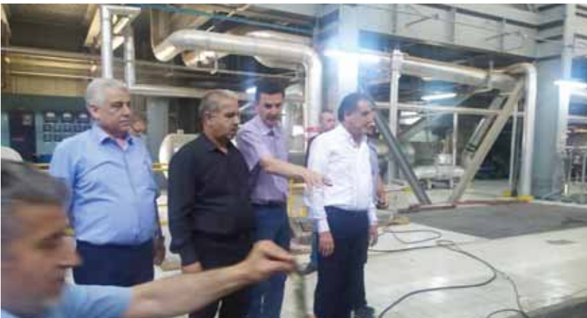
وزير الكهرباء ومحافظ حلب خلال تفتقدهما محطة حلب الحرارية أمس

ووفقاً له، فإن أمن أوكرانيا بنسبة ١٠٠ بالمائة، يعني توفير كمية كافية من الأسلحة القادرة على حماية مدينة أوديسا وهذا الجزء من ساحل البحر الأسود من البر، فضلاً عن إنشاء مهمة للقائم بدوريات لحماية ممر توريد الحبوب من قبل سفن الدول التي يمكن أن تنق بها