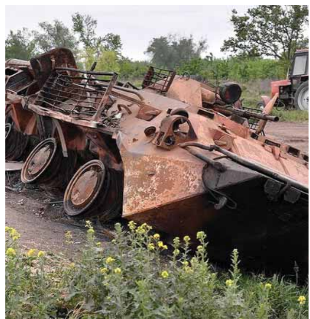
مدربة القوات الأوكرانية تم تدميرها في معارك دونباس

الخيارات يمكن أن يكون تسخير قافلة إنسانية ترافقها سفن البحرية الأمريكية لضمان المرور الآمن لسفن الحبوب عبر البحر الأسود. وزير الخارجية والتعاون الدولي الإيطالي لويجي دي مايو، قال: «إن أسعار القمح والمنتجات الأساسية الأخرى المرتفعة أصلاً بسبب «كورونا»، وصلت اليوم إلى أعلى مستوياتها على الإطلاق». بدوره اعتبر الرئيس الصربي ألكسندر فوتشيتش، أنه في حال قطعت روسيا ولسبب ما إمدادات الغاز عن أوروبا وارتفعت أسعار الطاقة الكهربائية، سيواجه الاتحاد الأوروبي «سيناريو جهنمي». وقال فوتشيتش: «أسوأ سيناريو للجمع هو أن تقطع روسيا لسبب ما إمدادات الغاز إلى أوروبا، لأن خصوصاً ما لا يدفع بالروبل، أو لا يريد ذلك، وفي حال تقص الغاز، سيرتفع سعر الكهرباء إلى ٣٢٠-٣٥٠ يورو لكل ميغاواط، وهذا حجم للجمع».