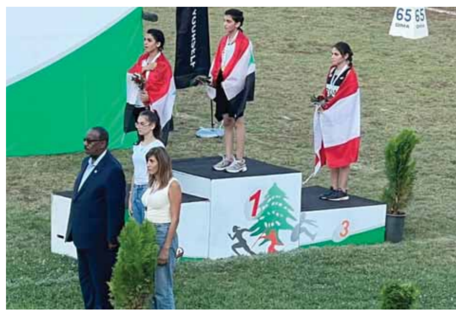
فريق سوريا يتسلم الجوائز

رئيس اتحاد ألعاب القوى يقول: نحن مع فكرة المدرب الأجنبي ومع هذا الطرح، وطالما بذلك، وكنا على استعداد لجلب المدرب الأجنبي مع موافقة المكتب التنفيذي، لكن للأسف لم نتحقق الفكرة مع إصرار اللاعب على عدم استقدام أي مدرب أجنبي ما قطع الطريق أمام تنفيذ هذه الفكرة.