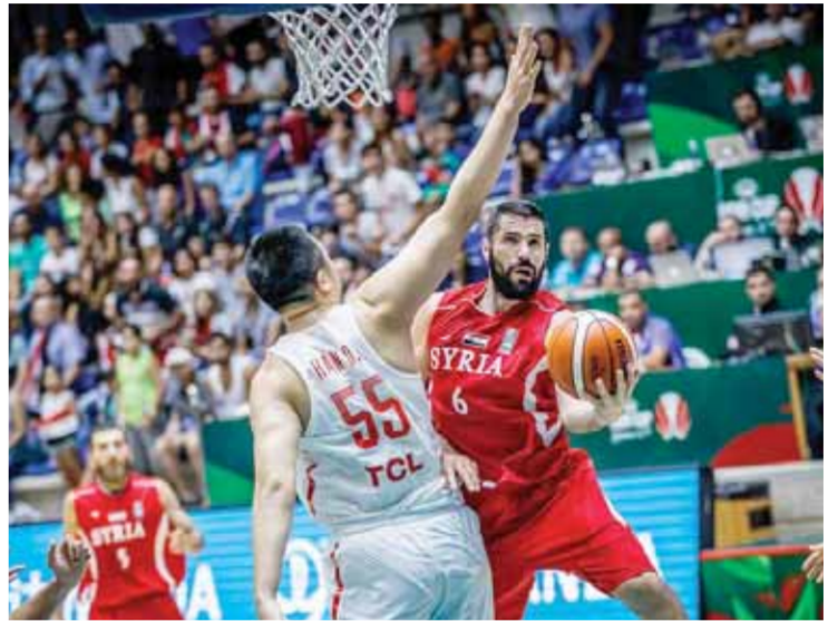
من آخر مشاركة في لبنان ٢٠١٧

على الرغم من الأزمة التي واجهتها سورية داخلياً على مر السنين الماضية، ظلت روح نسور قاسيون قوية دائماً، وها هم الآن قد عادوا إلى نسخة أخرى من كأس آسيا لكرة السلة ٢٠٢٢ ستقام في العاصمة الإندونيسية جاكارتا خلال الفترة من ١٢ حتى ٢٤ الشهر الجاري.