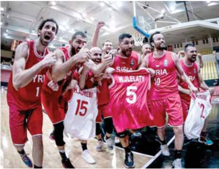
بعد الفوز على إيران في الدوحة

وقع منتخبنا في المجموعة الرابعة إلى جانب اليابان، الكويت، فيجدهما احتل منتخبنا المركز الأول على حساب اليابان، وتأهلتا