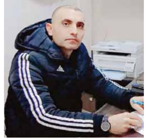
وبين جماهيره منذ نحو عشرة مواسم، الأمر الذي حقق مقبلاً حقيقياً لبقاء الفريق بين أحياء الأقباط خلال المواسم الفائتة!