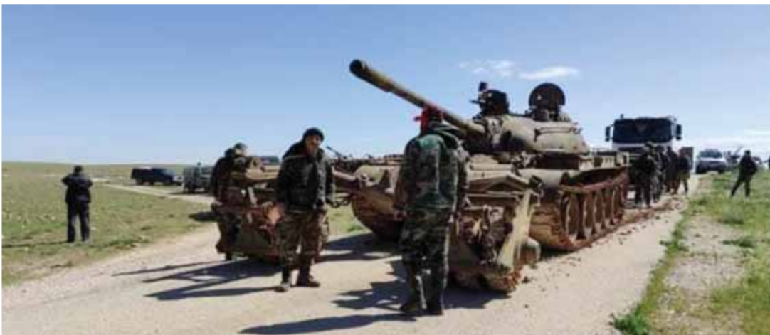
قوات للجيش العربي السوري لتدعيم وحداتها المنتشرة بريف الرقة

مع مواصلة قوات الجيش العربي السوري تدعيم وحداتها المنتشرة بريف الرقة، من خلال إنشاء ٣ نقاط عسكرية جديدة بالقرب من الطريق الدولية المعروفة بـ«m4»، واستقدام تعزيزات إلى نقاط التماس مع الاحتلال التركي بريف تل أبيض الغربي شمال المحافظة، كشفت الرئاسة الإيرانية عن موقف فرنسي لفت تجاه نياب النظام التركي بشأن عدوان على سورية مبيحة تأييد فرنسا ودعمها موقف طهران المعارض لشن عمليات عسكرية. الرئيس الإيراني إبراهيم رئيسي أكد خلال اتصال هاتفي مع نظيره الفرنسي إيمانويل ماكرون، أن التدخل الأجنبي يزعزع الأمن والاستقرار في المنطقة، مشيراً إلى أن حل قضاياها هو بيد شعوبها وحكوماتها، وقال: «لولا دور إيران في محاربة الإرهاب ودعم وحدة أراضي الدول وسيداتها في المنطقة لكان تنظيم داعش الإرهابي أعن عن تأسيس دولته في أوروبا اليوم»، مجدداً التأكيد على موقف بلاده الرافض لخيار الصراعات والحروب لحل الخلافات بين الدول المختلفة.