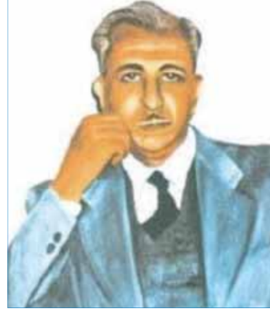
خير الدين الزركلي