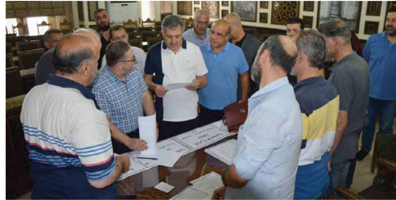
محافظ دمشق محمد طارق كرشياتي يتفقد سير عملية تقديم طلبات الترشح للانتخابات