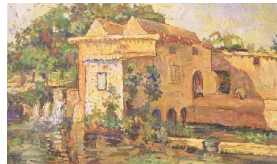
طاحونة في طريق عريين