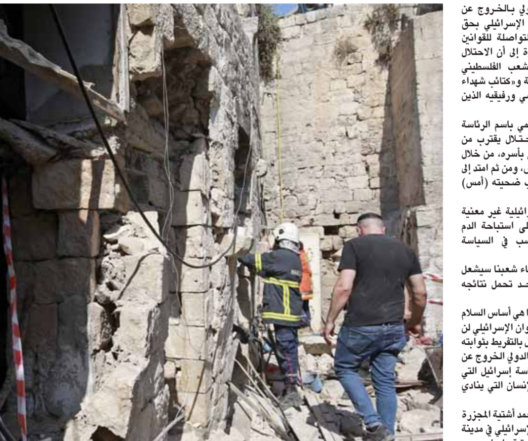
فلسطينيون يشترون زجاجاً خلال جلاء جثة شهيد، في غارة لجيش الاحتلال الإسرائيلي على مدينة نابلس بالضفة الغربية

جندت رام الله مطالبة المجتمع الدولي بالخروج من ضمة الحرب ووقف جرائم الاحتلال الإسرائيلي بحق الفلسطينيين ووضع حد لتهاتاته المتواصلة للقوانين الدولية ومبادئ القانون الإنساني، وذلك في الاحتفال بمرور ١٠٠ العاجية للشعلة من الشعب الفلسطيني.