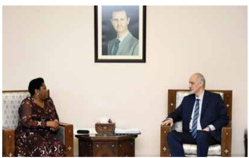
نائب وزير الخارجية والمغتربين خلال استقبلته نائب وزيرة العلاقات الدولية والتعاون في جمهورية جنوب إفريقيا

الدول إلى المبادئ وليس إلى المصالح الآتية، مشيراً إلى أن البعد الجغرافي لا يشكل عائقاً في تطوير العلاقات بين البلدين فسورية تربطها أقوى العلاقات مع الدول البعيدة جغرافياً مثل جنوب إفريقيا ودول أميركا الجنوبية. بدورها أكدت دلايني أن بلادها تقف بقوة إلى جانب سورية حكومة وشعباً وحققها في الدفاع عن سيادتها الكاملة ووحدة أراضيها ومحاربة الإرهاب، مددة بالإجراءات القسرية أحادية الجانب المفروضة على الشعب السوري والمخالفة للقانون الدولي.