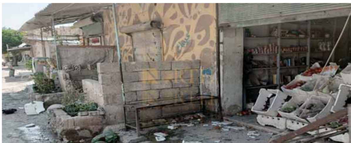
السوق الشعبي بمدينة تل رفعت الذي قصفه جيش الاحتلال التركي بمسيرة «درون»

وقالت المصادر: إن الاحتلال التركي ركز قصفه المدفعي أمس باتجاه بلدتي الكوزلية وتل اللين في ريف تل رفعت شمال غرب الحسكة، ولفت إلى جرح مدني واحد كان يرعى الأغنام بالقرب من الثانية، عدا عن وقوع أضرار بالغة في ممتلكات المدنيين. وأضافت: إن جيش الاحتلال، ومن داخل مخافره الحدودية مع ريف الحسكة الشمالي، وجه رميات مدفعية أمس صوب محيط بلدة الدرباسية وبلدة جطل الحدودية من دون معرفة وقوع إصابات في صفوف المدنيين، على حين دارت اشتباكات متقطعة مع ميليشيات «قوات سورية الديمقراطية-قسد»، الانفصالية، وسقطت قذائف هاون داخل الأراضي التركية.