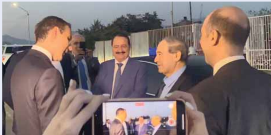
وزير الخارجية والمغتربين فيصل المقداد يبدأ زيارة لجمهورية أبخازيا (سانا)

أن زيارة المقدم لجمهورية أبخازيا ستستغرق عدة أيام، يلتقي خلالها كبار المسؤولين وعلى رأسهم الرئيس الأبخازي أصلان بزانيا الذي سيلتقيه اليوم. وأشارت المصادر إلى أن المقداد سيبحث مع المسؤولين الأبخاز لتطوير العلاقات الثنائية لاسيما على صعيد التعاون الاقتصادي، كما سيجري التوقيع على مذكرة تفاهم لتطوير التعاون بين وزارتي خارجية البلدين. وأضاف المصدر: إن وزير الخارجية الأبخازي إيغال أرزينبا استقبل المقدم على الحدود الأبخازية الروسية. إلى ذلك أفاد وزير الخارجية الأبخازي في مقابلة صحفية بأن اللقاء مع المقدم يأتي في سياق تعزيز العلاقات بين سورية وأبخازيا. وأوضح المقدم أن سورية كانت من أوائل الدول التي اعترفت باستقلال جمهوريتي دونيتسك ولوغانسك الشعيبين، كاشفاً أنه يتم العمل لإقامة علاقات دبلوماسية وتبادل البعثات خلال الأيام القليلة القادمة. ووقعت سورية وأبخازيا في التاسع والعشرين من أيار الفاتت بمقر وزارة الدفاع في دمشق، على اتفاقية تعاون مشترك في إطار تعزيز علاقات الصداقة والتعاون بينهما.