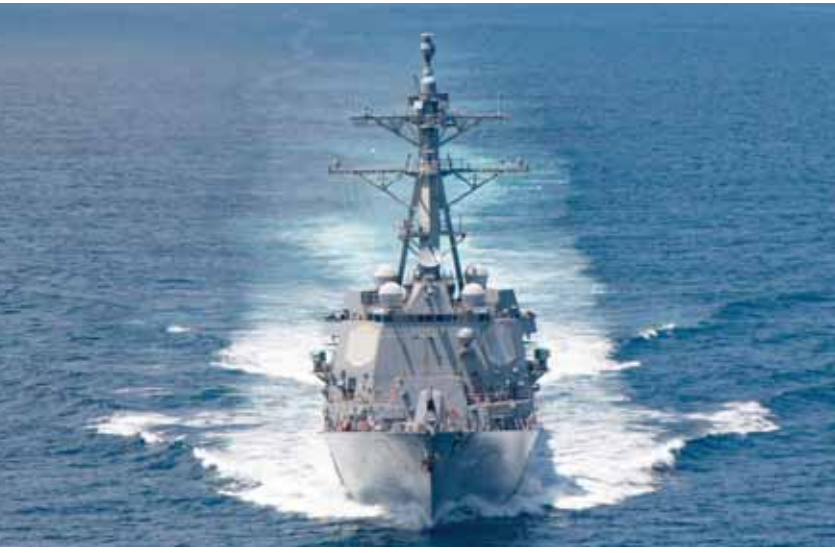
الدمرة الأميركية يو إس إس كيد تعبر مضيق تايوان