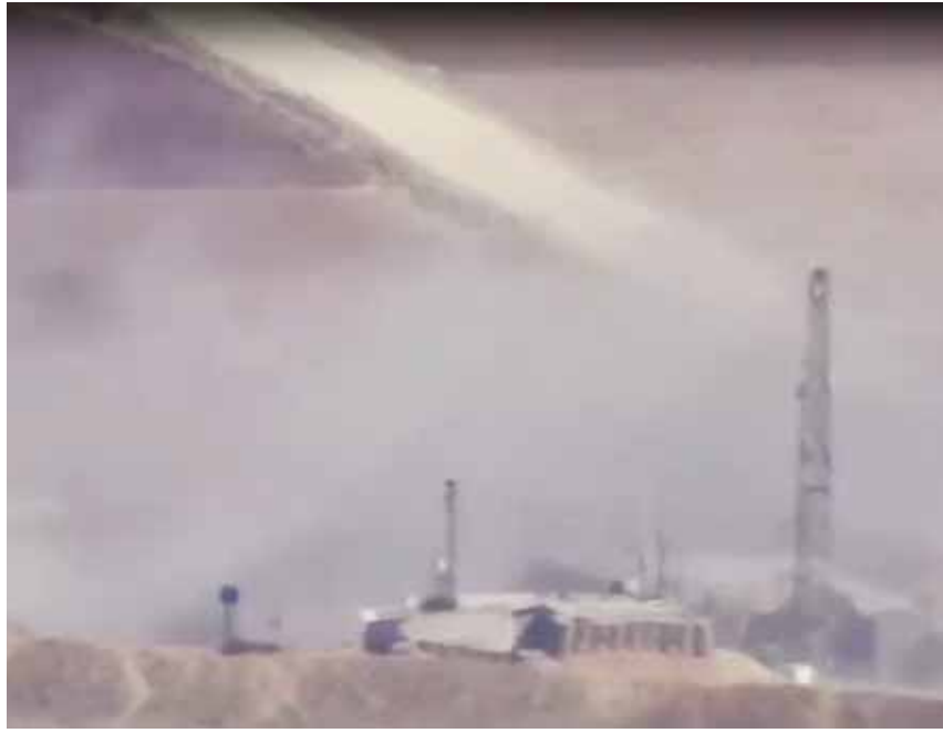
لقطة فيديو تظهر لحظة استهداف نقطة تمرکز لقوات الاحتلال التركي في عفرين

وكان وزير الخارجية والمغتربين فيصل المقداد أكد خلال مؤتمر صحفي جمعه مع نظيره الروسي سيرغي لافروف الأسبوع الفائت، أن هناك استحقاقات يجب أن تقوم بها تركيا وأن تتم على أساس احترام سيادة الدول، لكي تعود العلاقات بين البلدين إلى ما كانت عليه قبل بدء الحرب الإرهابية في سورية، موضحاً أن هذه الاستحقاقات هي إنهاء الاحتلال ووقف دعم الإرهاب وعدم التدخل في الشؤون الداخلية لسورية وحل مشكلات المياه بين البلدين، معتبراً أن هذا يشكل مقدمة لإعادة العلاقات إلى ما كانت عليه.