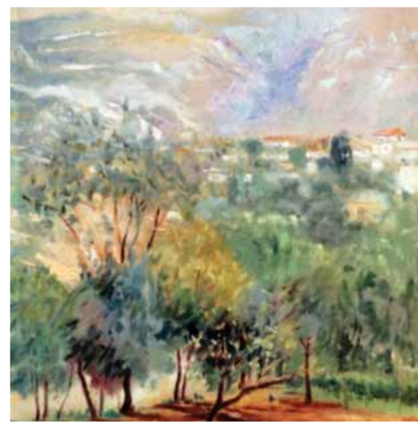
منظر من جبثا ١٩٥٥ - - المتحف الوطني في دمشق

أقدر الفنانين على إظهار النزعات الفنية الحديثة في لوحاته