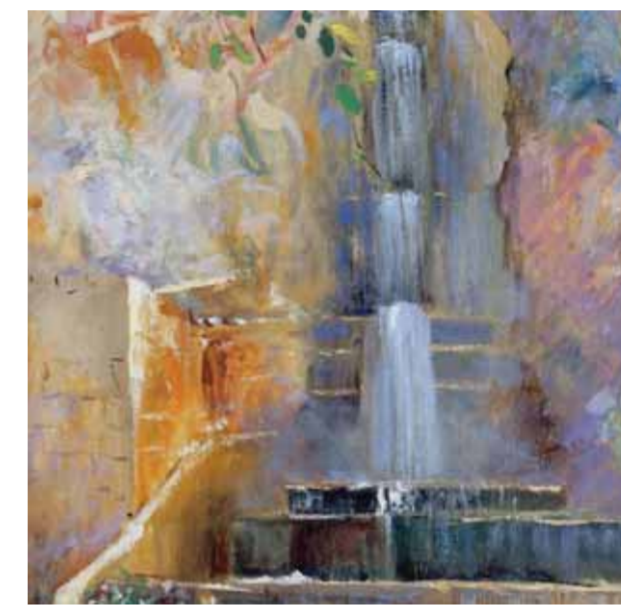
شلالات الربوة - ١٩٥٥ - المتحف الوطني في دمشق