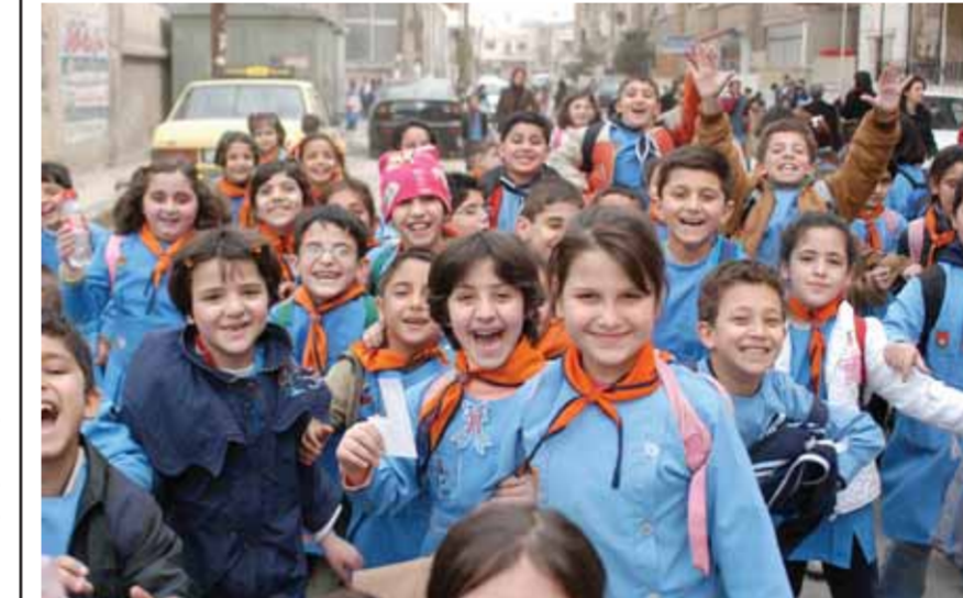
ملايين الطلاب في مختلف المراحل التعليمية يتوجهون اليوم إلى مدارسهم

وتطلب أجور النقل ذاتها من كل الطلاب رغم وجود فارق كبير في المسافات بين المناطق التي يسكنها كل منهم. وفيما يتعلق بموضوع المفاضلة الجامعية بين نائب رئيس جامعة دمشق للشؤون الإدارية وشؤون الطلاب محمد تركو أنه تم تخصيص ٣٠ مركزاً للتسجيل على المفاضلة بدمشق بالنسبة للفرعين العلمي والأدبي ومفاضلة السوري غير المقيم ومفاضلة العرب والأجانب ومفاضلة أبناء أعضاء الهيئة التدريسية، مع تخصيص مراكز وكوات خاصة بالنسبة لمفاضلة ذوي