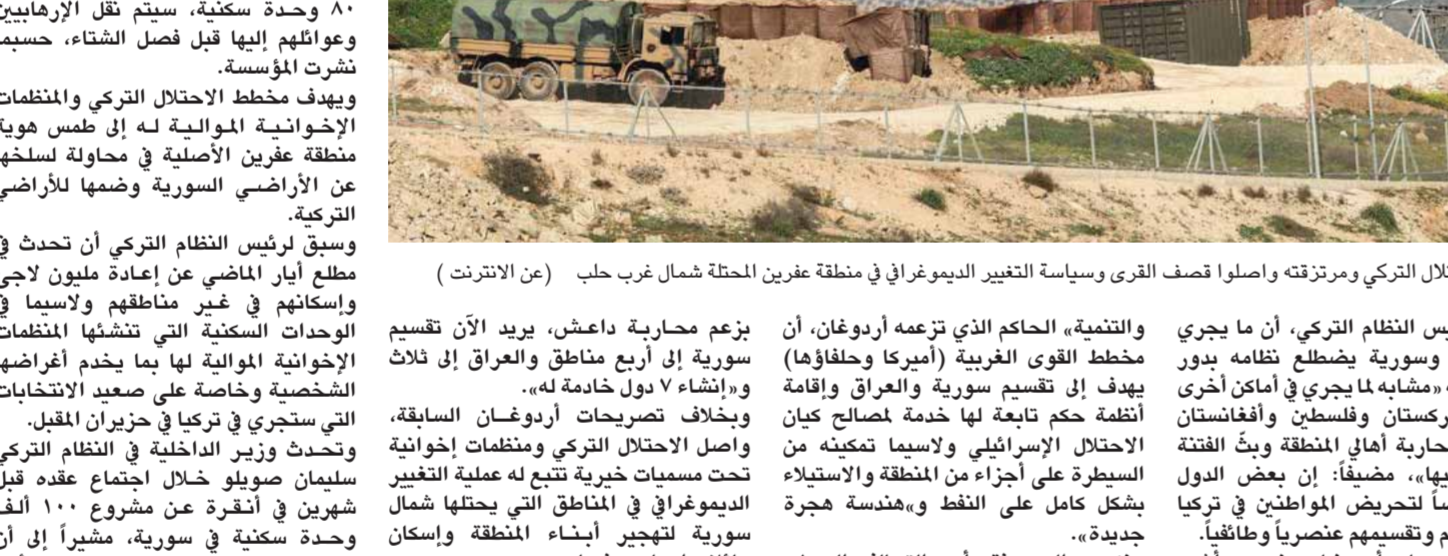
الاحتلال التركي ومرتزقته وأصلوا نصف القرى وسياسة التغيير الديموغرافي في منطقة غربيين شمال غرب حلب

بزع محاربة داعش، يريد الآن تقسيم سورية إلى أربع مناطق والعراق إلى ثلاث ولايات، وإشياء لا حول هالامة..