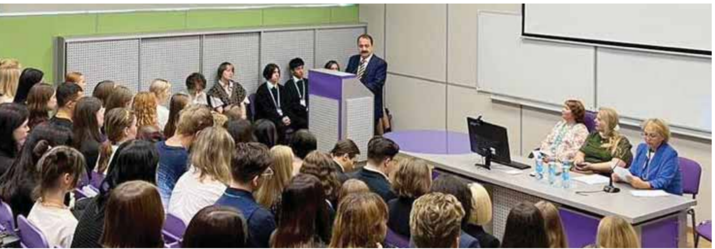
الوزير د.رياض حداد يلقى محاضرة على طلاب جامعة سلا بطبرسبورع العلاقات الدولية

في الوقت الذي اعتبرت فيه كازاخستان، أن مسار محادثات «أستانا» لسلام حول سورية ليس بديلاً عن مسار جنيف، بل عملاً له، أكد السفير السوري لدى روسيا الاتحادية رياض حداد، أن هزيمة المشروع الأميركي في سورية كان له أثر كبير على تغيرات النظام الدولي، فضلاً عن محادثات أستانا حول سورية، مؤكداً أن هذا الأمر يشكل تحدياً جدياً للعالم، مؤكداً أن هذا الأمر يشكل تحدياً جدياً للعالم، مؤكداً أن هذا الأمر يشكل تحدياً جدياً للعالم.