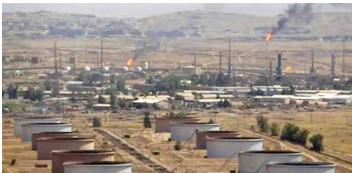
حقل العمر النفطي بريف دير الزور الشرقي حيث دوت الانفجارات في قاعدة الاحتلال الأمريكي

كيان خاص بهم». واعتبر رئيس النظام التركي، أن ما يجري في العراق وسورية «مشابه لما يجري في أماكن أخرى كاليمن وتركيستان وفلسطين وأفغانستان من قتل ومحاربة أهالي المنطقة وبث الفتنة الطائفية فيها»، مضيفاً: إن بعض الدول تسعى أيضاً لتحريض المواطنين في تركيا ضد بعضهم وتقسيمهم عرصياً ووطائفياً. وتأتي تصريحات أردوغان في وقت تواصل فيه قوات بلاده المحتلة لاجراء واسعة من الأراضي السورية شمالاً قصفها ولليوم الثالث على التوالي، قرى ريف محافظة الحسكة الشمالي، حيث سقطت قذائف على قرى دير الزور وأم الكف الخاضعتين لسيطرة ميليشيات «قسد» بريف ناحية تل تمر. على الضفة الميدانية المقابلة، دوت انفجارات عدة مساء أمس في قاعدة الاحتلال الأمريكي في حقل العمر النفطي بريف دير الزور الشرقي، وأفادت مصادر محلية في دير الزور لمراسل «ساتنا»، بسماع دوي الانفجارات من القاعدة تلاها تصاعد سحب الدخان من داخلها ولم يتم التأكد من طبيعة تلك الانفجارات. ولفت المصادر إلى أنه تلا الانفجارات تحليق مكثف لطيران الاحتلال الأمريكي في أجواء المنطقة. واستهدف هجوم بالصواريخ قاعدة الاحتلال الأمريكي في حقل كونيكو النفطي في الثامن والعشرين من الشهر الماضي، وأدى حسب تقارير صحفية أميركية إلى وقوع إصابات في صفوف قوات الاحتلال وأضرار مادية.