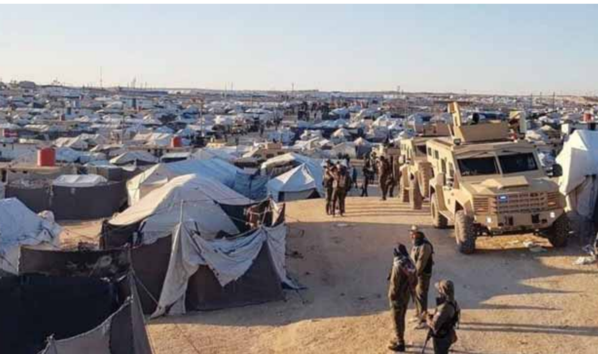
مليشيات «قوات سورية الديمقراطية» - سدة - واصلت حملة الاعتقالات لثمنها في مخيم الهول، جنوب شرق الحسكة لثلاثين يوماً.

بدأت واصلت عمليات تسليم قوات سورية الديمقراطية - سدة - حملة الاعتقالات لثمنها في مخيم الهول، جنوب شرق الحسكة لثلاثين يوماً، كشفت مصادر أمنية عراقية عن تهريب عدد من متزعمي تنظيم داعش الإرهابي من العراق إلى استراليا.