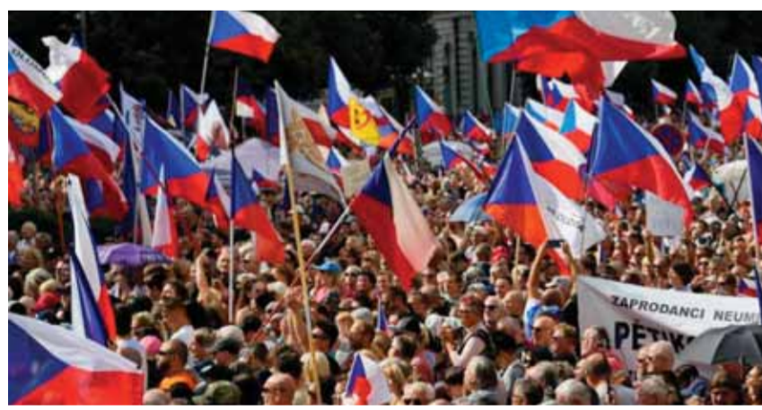
٧٠ ألف شخص تظاهروا أمس في براغ عاصمة جمهورية التشيك

سيرغي ريبكوف أن درجة مشاركة الولايات المتحدة في الوضع حول أوكرانيا مستمرة في الازدياد، بما في ذلك من خلال توفير الدعم العسكري، وهذا اتجاه خطير. ونقلت وكالة «تاس» عن ريبكوف قوله أمس: «لقد حذرنا الولايات المتحدة مراراً وتكراراً من العواقب التي قد تحدث عندما تقوم الولايات المتحدة، بمثل هذا الضخ للأسلحة والانخراط في أشكال أخرى من الدعم المباشر لكيف، حيث إنها من خلال ذلك تضع نفسها في موقف قريب مما يمكن تسميته طرفاً في النزاع، وهو الخط الرفيع الذي يفصل الولايات المتحدة عن أن تصبح طرفاً من النزاع».