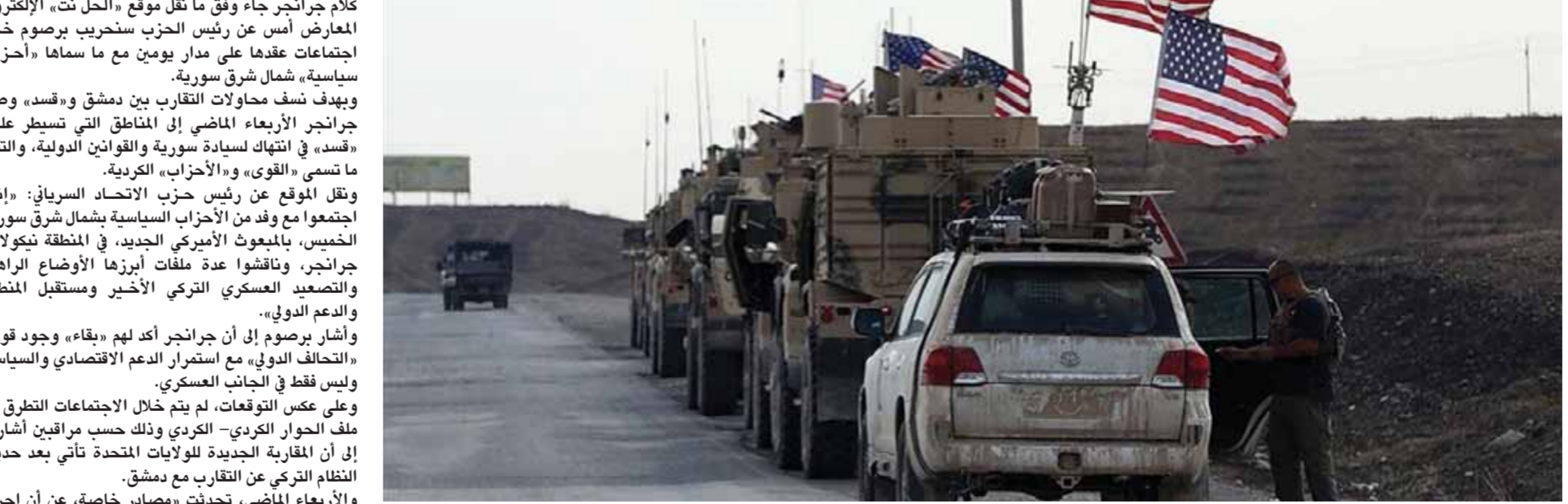
قوات أميركية في مدينة القامشلي شمال الحسكة

مصرين، الجوية منذ تشرين الأول ٢٠١٩، بالتزامن مع إنشاء أول احتلال أميركي بالتعاون مع «سدة» على سرتها في حوران الشمالي، وجرمان الغربية، والعايش من شرق سورية، وفي فترة وجيزة من القوات الروسية في الحسكة، حيث انخرطت القوات الأميركية في حقل النفط في الشمال الشرقي بالقرب من حقل رمضان النفطية، وتوزعت في الحسكة ودير الزور.