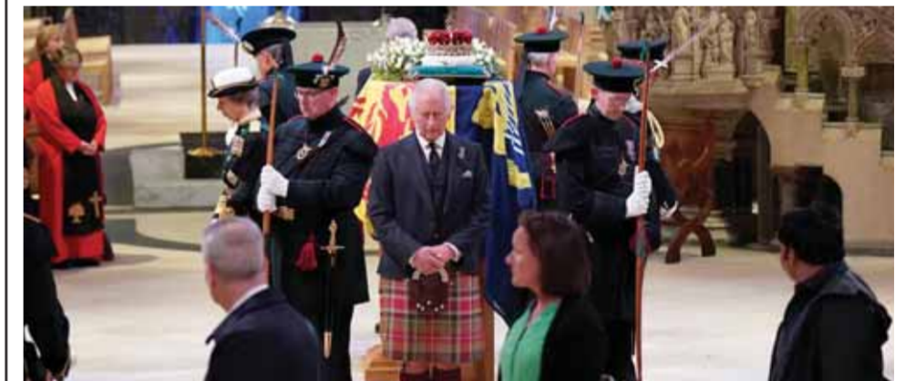
الملك تشارلز أمام نعش الملكة إليزابيث الثانية في إدنبرة

على مدار الساعة، حيث سيتمكن المشيعون من الإلقاء نظرة الوداع على النعش عندما يسجي بداية من مساء غدة الأربعاء إلى وقت مبكر من يوم الجنائز. ومن المتوقع أن يتوافد مئات الآلاف لتوديع الملكة قبل جنازتها الرسمية المقررة في ١٩ من أيلول، والتي سيحضرها عدد كبير من زعماء العالم. وقال مشغلو السكك الحديدية في بريطانيا أنهم يتوقعون «طلباً غير مسبق على السفر» داخل لندن، ونصحو الركاب بالاستعداد لتكلمة الطريق إلى وجهاتهم النهائية سيراً على الأقدام. وتعد تسجئة الجثمان تكريماً نادراً في بريطانيا، وتم منحه سابقاً في تسع مناسبات أخرى فقط معظمها لأفراد من العائلة المالكة، من بينهم والدة الملكة إليزابيث في عام ٢٠٠٢ عندما توفاه ما يقدر بنحو ٢٠٠ ألف شخص لإلقاء نظرة الوداع. وسيسبق تسجئة النعش موكب احتفالي عبر وسط لندن نقله من قصر بكنغهام إلى قاعة وستمنستر يوم الأربعاء.