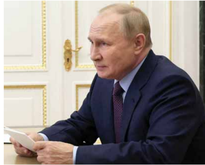
الرئيس الروسي فلاديمير بوتين يترأس اجتماعاً حول القضايا الاقتصادية عبر الفيديو في الكرملين

صفوفهم. وأضاف: «تم تدمير التعزيزات والقوات التي أرسلت من كييف، وأحرزنا تقدماً في مناطق دونيتسك وفولنوفاخا». من جانب أكد السفير الروسي لدى ألمانيا سيرغي نيتشاييف أن برلين تزود نظام كييف بأسلحة فتاكة تستخدم ليس ضد الجيش الروسي فحسب بل ضد السكان المدنيين. وقال نيتشاييف في حديث لصحيفة «إزفيستيا»، نشر أمس: إن حقيقة تزويد النظام الأوكراني بأسلحة فتاكة المانية الصنع التي تستخدم ليس ضد العسكريين الروس فقط ولكن أيضاً ضد المدنيين في دونباس هي خط أحمر يجب على السلطات الألمانية عدم تجاوزه. وأشار إلى أن إمدادات الأسلحة من ألمانيا إلى أوكرانيا تعدد النزاع وتزيد عدد الضحايا، معبراً عن قلقه بأن العديد من سكان ألمانيا يفهمون ذلك. في السياق أضاف المستشار الألماني أولاف شولتس، بأن ألمانيا لن تتخذ أي خطوات أحادية الجانب فيما يخص إمدادات الأسلحة إلى أوكرانيا، ولن تعمل في هذا الاتجاه إلا بالتعاون مع حلفائها. وفي وقت سابق أمس الممثل الدائم لروسيا لدى الاتحاد الأوروبي، فلاديمير تشيچوف، أنه يصد مغادرة بروكسل قريباً بعد ١٧ عاماً من تفعيل روسيا لدى الاتحاد الأوروبي. وقال تشيچوف للصحفيين الروس في بروكسل: «سأغادر قريباً، لقد انتهت رحلة عملي، من غير المريح بالفعل أن أكون بمثابة (نصب تذكاري) للشراكة الاستراتيجية بين روسيا والاتحاد الأوروبي».