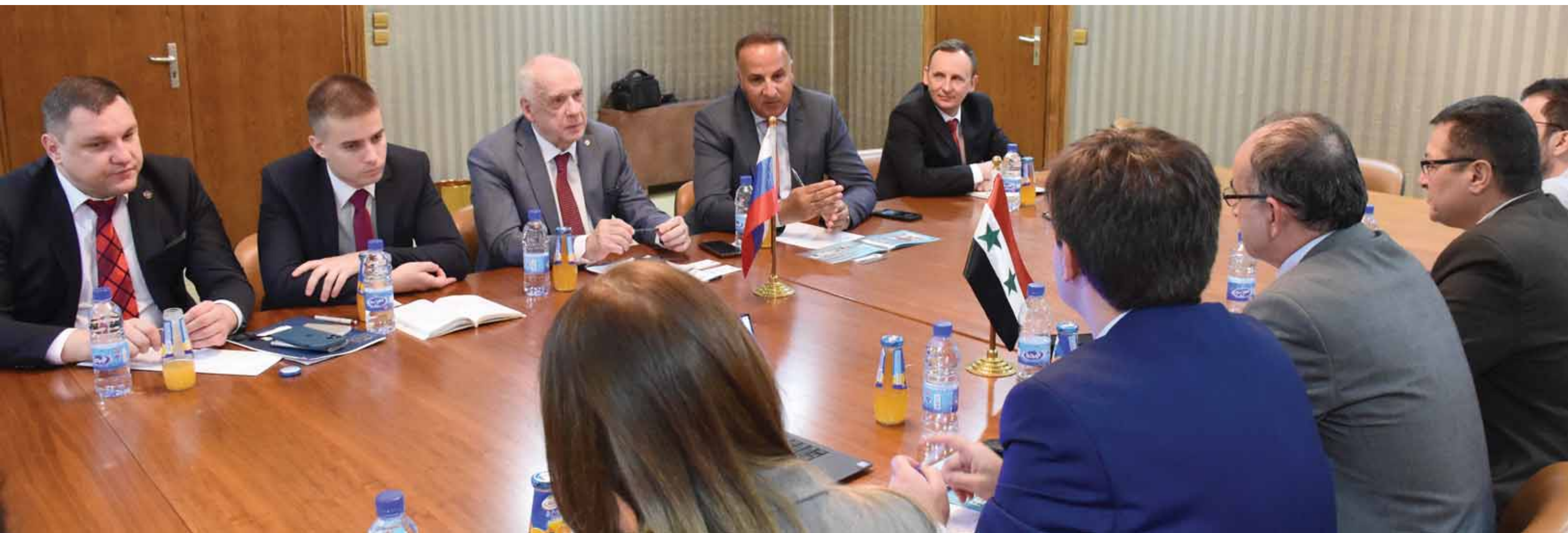
من جلسة مثلي حكومة جمهورية القرم الروسية مع ممثلي وزارة التعليم العالي والبحث العلمي

والتعليم والبحث العلمي، وتعليم الطلبة السوريين بالتخصصات اللازمة في مرحلة ما بعد الحرب. وأشار نيكولايفيتش، أنه يمكن تطوير طرق لتفصيل الخبز للطلبة السوريين، على أمل أن يتم توقيع اتفاقيات جديدة للتعاون بين جامعة القرم الحكومية الفيدرالية، وجامعة دمشق، والجامعات السورية الأخرى، داعياً الجانب السوري إلى زيارة جمهورية القرم الأوكرانية للتعاون في مجال معسكرات الطلاب الصيفية، وسعيًا لتطوير التعليم في اختصاصات الهندسة التقنية، وإنشاء صنعة وميكاترونكس والهندسة الاحيائية وجامعة دمشق. كما بحث ممثلون عن جامعة ريزان الحكومية للهندسة الاداعية مع وزارة التعليم العالي والبحث العلمي في سورية إمكانية توقيع اتفاق تعاون مشترك. وتساءل وزير التعليم في اختصاصات الهندسة التقنية، إنكارا عن جامعة باومان موسكو التقنية الروسية اتفاقية تعاون لتطوير الأبحاث والشاريع المشتركة. وتبادل الكبار التدريسي والطلاب بين الطرفين.