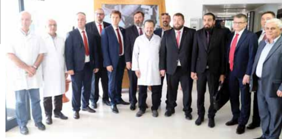
وفد روسي يطلع على واقع العمل في شعبة الأمن العرن بمشفى تشرين الجامعي (سانا)

زار وفد حكومة منقطة نينجي نوفغوروف في الروسية في مدينة نينجي نوفغوروف على واقع العملية التدريسية في عدد من كليات جامعة تشرين وبحث مع عمدائها أفاق التعاون بين الجانبين. عقب جولة في مختبر كلية الهندسة للعلوم والعلوم التطبيقية في جامعة تشرين ليشمل المزيد من التخصصات. وهناك اهتمام مشترك في مجال التكنولوجيا الحديثة التي لها تأثير كبير في مجال مواد البناء وإيجاد مواد بناء جديدة يمكن تطوير العلاقات بين الجانبين الروسيين والروسية. وأكد في إطار التعاون العلمي المشترك، ونقلت وكالة «سانا» عن نائبكوف قوله: إن هدف الزيارة الإطلاع على واقع العمل في شعبة أمراض العين وجراحاتها، معرباً عن إعجابها بالمشفى وما يوفره من رعاية متميزة للمرضى، منوهاً بقرارات الأطباء والطلاب السوريين واندفاعهم للتحسين والدراسة.