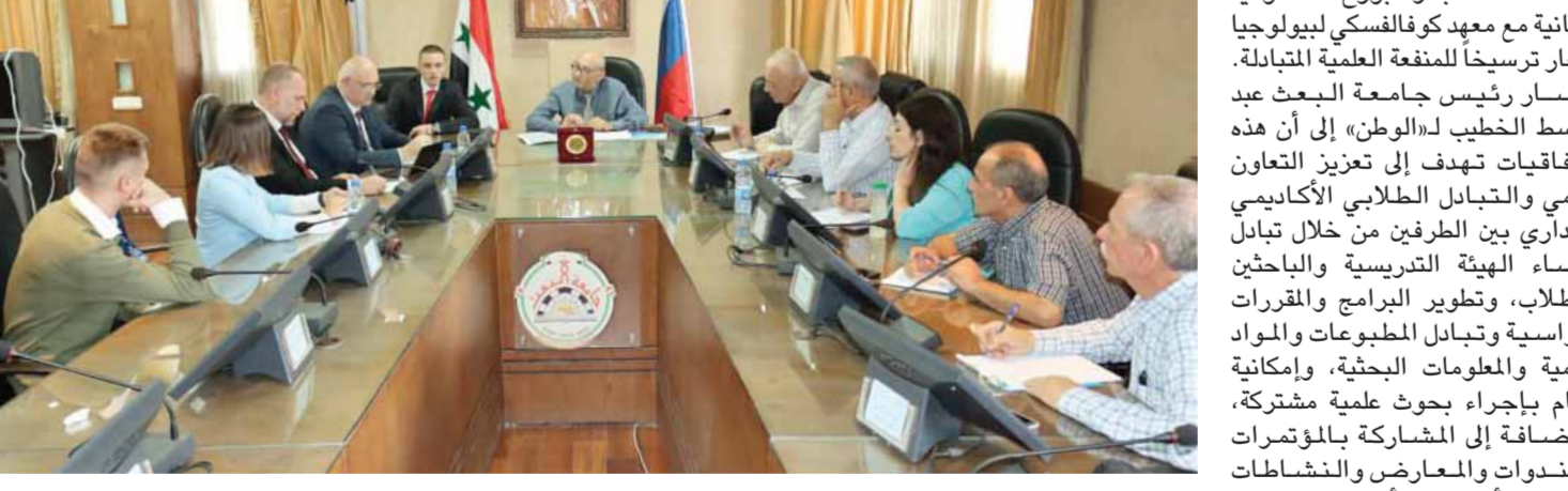
جامعة البعث توقع اتفاقية تعاون على مشتركة مع جامعة سانت بطرسبورغ الحكومية والثانية مع معهد كوفالسكي لبيولوجيا البحار (خاص الوطن)

البلدين، أكد ممثل وزارة التعليم العالي الروسية سيفيلانا شفيريوفا في توقيع اتفاقية تعاون علمية مشتركة بين جامعة «البعث» و«سانتاتكين». رئيس جامعة «البعث» ستاتكين، فلاديمير سبيرياني أكد له «الوطن»، إن هذا الاتفاقية هي جسر للتواصل بين الثقافتين السورية والروسية، مشيراً إلى أن استمرار مثل هذه النشاطات والفعاليات التي تسهم في التنمية الاقتصادية والاجتماعية، كشفت رئيس جامعة باومان البروفيسور ميخائيل فاليريوفيتش غورون عن وجود ٢٠ طالباً سورياً من طلاب هيئة التميز والإبداع، في برنامج الماجستير والدراسات العليا للجامعة، وأنه بموجب الاتفاقية سيتم زيادة أعداد الطلاب.