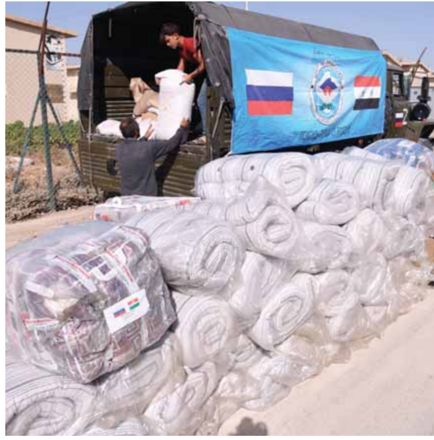
مساعداً روسية في مركز إيواء الحرجلة في ريف دمشق (سانا)

قدم وفد روسي يضم أعضاء من البعثة الإنسانية الروسية في سورية مساعداً غذائية وعينية متنوعة ومواد كهربائية لمركز إيواء المهجرين في بلدة الحرجلة بريف دمشق، خلال زيارة قام بها للمركز أمس. وتلقى وفد العمل والحمائية الاجتماعية في دمشق توكيداً من مركز إيواء مساعدات وكافة الإيواء. وتتمثل المساعدة الإنسانية للشعب السوري، والتي تحمل أهدافاً إنسانية للشعب