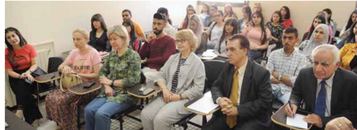
قواعد اللغة الروسية ومنهجية تعليمها في محاضرة بجامعة دمشق (سانا)