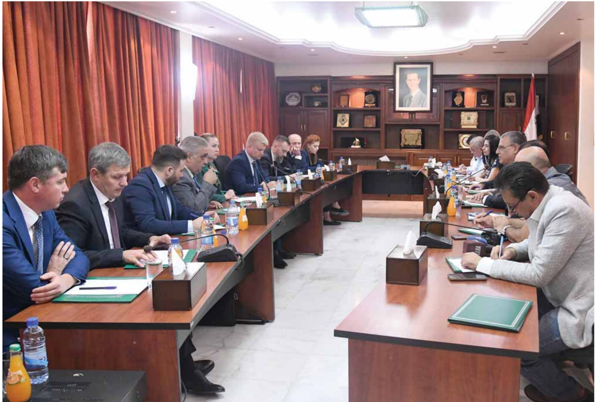
مباحثات زراعية سورية مع جمهورية بولندا الشقيقة (سانا)

وضع خريطة لتبادل السلع والمنتجات الزراعية بالإضافة إلى تحديد مواعيد لاستكمال ما تم الاتفاق عليه.