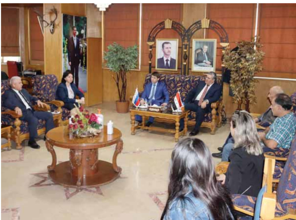
حمص - نبال إبراهيم

بحث رئيس جامعة البعث عبد الباقى الخطيب أمس مع رئيس جامعة شمال القوقاز الاتحادية ييمتري بيسبيلوف والوفد المرافق له، سبل تطوير التعاون العلمي والتفاني بين الجانبين، داعياً إلى مضاعفة الجهود لإجراء أبحاث علمية مشتركة بين الجامعتين.