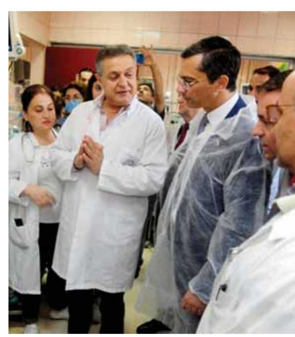
وفد برلماني روسي يزور مشفى المجتهد ويقدم ٤ حواضن

قدم وفد روسي يضم أعضاء من البعثة الإنسانية الروسية في سورية مساعداً غذائية وعينية متنوعة ومواد كهربائية لمركز إيواء المهجرين في بلدة الحرجلة بريف دمشق، خلال زيارة قام بها للمركز أمس. وتلقى وفد العمل والحمائية الاجتماعية في دمشق توكيداً من مركز إيواء مساعدات وكافة الإيواء. وتتمثل المساعدة الإنسانية للشعب السوري، والتي تحمل أهدافاً إنسانية للشعب