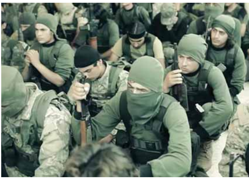
مجموعة من إرهابيي «النصرة» يستعدون للمغادرة إلى أوكرانيا (عن الانترنت)

أوضحت المصادر أن معبر بلدة خربة الجوز غير الشرعي مع تركيا يرفج جسر الشغور، أهم بوابة للعبور إلى تركيا، التي تقدم استخباراتها الدعم اللوجستي اللازم لإتمام المهمة، وكذلك المعابر غير الشرعية قرب بلدة زركوش شمال غرب إدلب، وحتى معبر باب الهوى شمال المحافظة. وقدرت عدد الإرهابيين الذين غادروا إدلب إلى أوكرانيا خلال الأسبوعين الأخيرين بأكثر من ٧٠ إرهابياً، منهم مئتمون لدى التنظيمات الإرهابية في «القاعدة»، مثل عبد الحكيم الشيشاني مترع «أجناد الفوقان». على صعيد مواز، بين مصدر ميداني لـ«الوطن»، أن المجموعات الإرهابية لليوم الثاني في هذا الأسبوع،