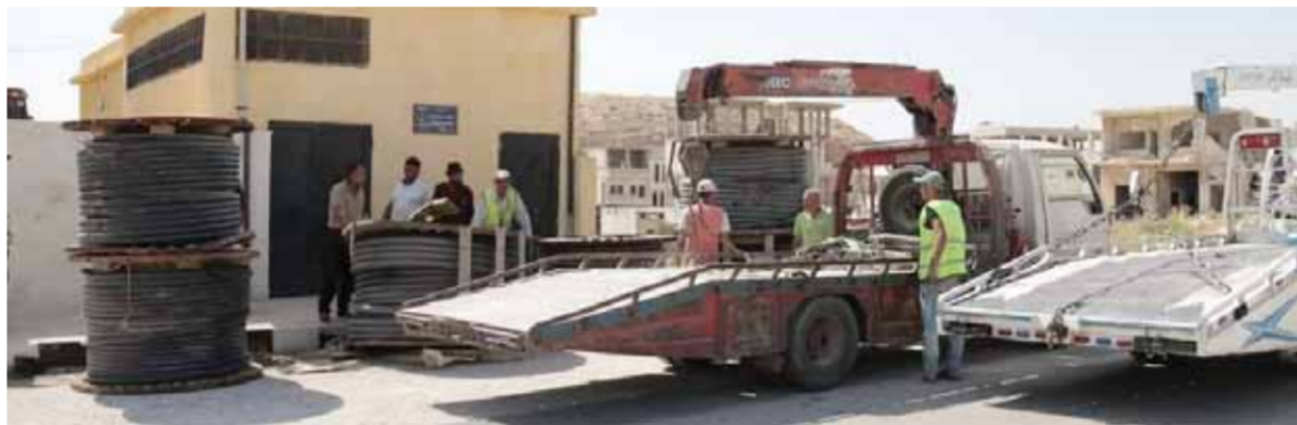
محافظة إدلب تعمل على تجهيز مركز النافذة الواحدة في خان شيخون خلال يومين من أجل تسهيل وتبسيط إجراءات عودة الأهالي إلى مدينة المعرة (عن الانترنت)

مع مناطق سيطرة التنظيمات الإرهابية في إدلب وحلب، قال محافظ إدلب: «حتى الآن لا يوجد قرار، علماً أن المنافذ الإنسانية التي افتتحها الحكومة مفتوحة ولكن هم في الشمال (الإرهابيون) يمنعون الأهل من الخروج إلى مناطق سيطرة الدولة»، لافتاً إلى أن الأهالي وفي ظل هذا الوضع بلجؤون إلى الخروج من المتواجدين في مناطق الشمال يأتون إلى مركز التسوية الذي افتتحته الحكومة السورية في مدينة خان شيخون ويقومون بتسوية أوضاعهم، مؤكداً أن المركز يشهد إقبالاً من الراغبين بتسوية أوضاعهم.