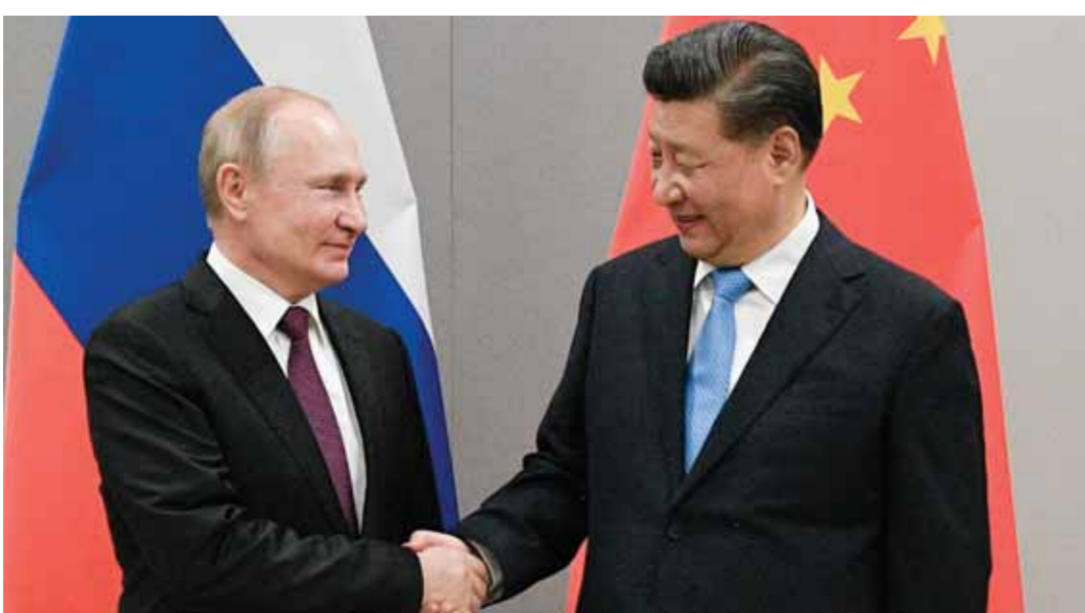
من لقاء سابق للرئيس الروسي فلاديمير بوتين والرئيس الصيني شي جين بينغ

وقال نيبينزيا في اجتماع مجلس الأمن عقد بسبب التفجيرات التي وقعت الأسبوع الماضي على خطي أنابيب «السيل الشمالي ٢»، المعتد من روسيا إلى أمانيا عبر قاع البحر، أن السؤال الرئيس: هل ما حدث مع «السيل الشمالي» مفيد للولايات المتحدة؟ لا شك في ذلك، يجب أن يحتفل