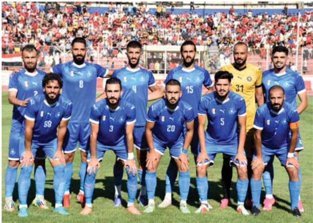
| دير الزور- جمال العبد الله

فوز صريح وأداء مقنع أسفر عنه لقاء القوة بين الكرامة والفتوة بحمص، وقد أفرح هذا الفوز جماهير الفتوة لكونه بأرض الكرامة وإن دل هذا الفوز فإنه يدل على الحالة الصحية والخط البياني المتصاعد والاستقرار الفني الذي يلف مسيرة الفتوة ورافق الفوز أداء متوازن ومقنع لأزرق الدبر ظهرت فيه لمسات مدربه الرادوي، حيث سيطر الفتوة على مجريات الشوط الأول وامتلك الكرامة النصف الأول من الشوط الثاني لكن بلا فائدة وقيبت الأفضلية والنتيجة للصيوف الذين ظفروا بالنقاط كاملة وهو فوز محرز أعطاهم جرعة إضافية للاستمرار بالنتائج الطيبة نحو المنافسة على البطولة.