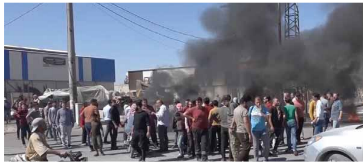
عصيان وتظاهرات ضد وجود الاحتلال التركي في مدينة الباب

حلب - خالد زكولو حمّات - محمد أحمد خبازي