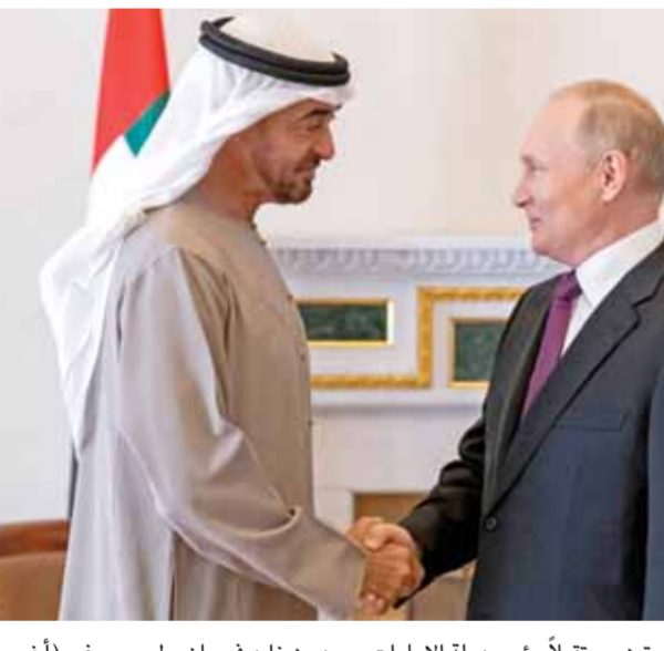
الرئيس الروسي فلاديمير بوتين مستقبلاً رئيس دولة الإمارات محمد بن زايد في سان بطرسبورغ

من جهته اعتبر المتحدث باسم الكرملين ديميتري بيسكوف أن المواجهة ستستمر مع الغرب، مضيفاً: إن «روسيا ستحقق أهدافها المحددة في أوكرانيا»، مبحراً من أن إرسال أنظمة الدفاع الجوي سيجعل النزاع أكثر إيلاماً لكيف. وفي تطور لافت جديد، كشف حلف شمال الأطلسي، أنه سيجري تدريبات على السرعة النووي، وبهدف المحافظة على قدراتها على الردع، أمنة وفعالة، وأضاف: «نريد أن نُبعد أي تهديد عن أراضي دول «الثاتو»، لكن لا نرغب في أن تسيء روسيا فهم ذلك على نحو يدفعها إلى التصعيد».