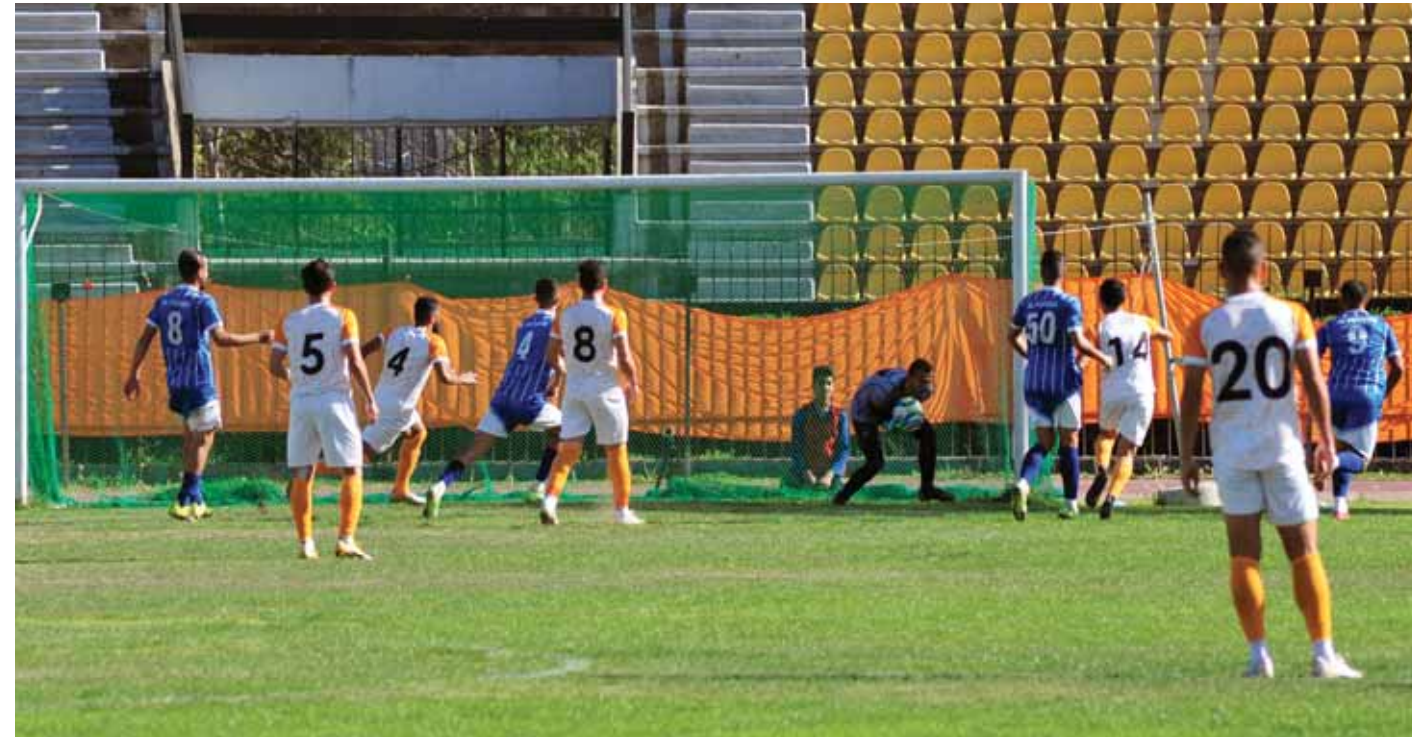
من مباراة الوحدة والفتوة (أرشيف)

شح تديفي واضح في مباريات المرحلة الرابعة من ذهاب الدوري الكروي الممتاز، فبلغت الأهداف سبعة في ست مباريات سجل نصفها تقريباً فريق الفتوة، والتسجيل كان للفتوة بواقع ثلاثة أهداف، وهدف واحد سجله الوثبة وجبلة والطليعة الوحدة بينما عجزت سبعة فرق عن التسجيل، وهذا يؤكد وجود مشكلة في العملية الهجومية سواء على صعيد الهادفين أو على صعيد أسلوب اللعب، علينا ألا نستبعد عودة ملاعبنا في الحد من العمليات الفنية التي تمهد الطريق إلى المرمى.