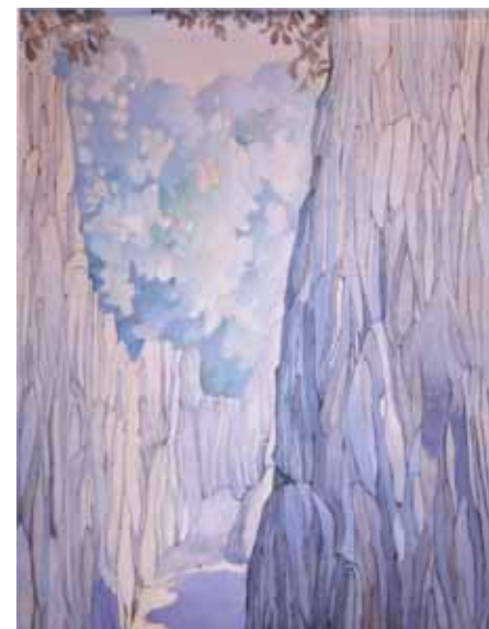
فج معلولا ١٩٥٧