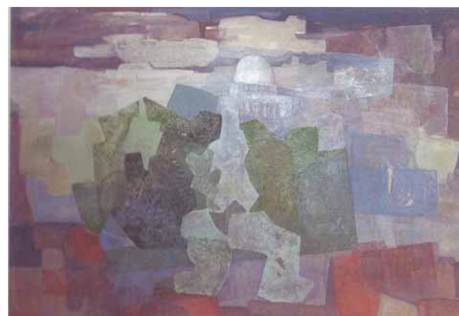
المسجد الأقصى ١٩٦٨ - متحف حلب الوطني