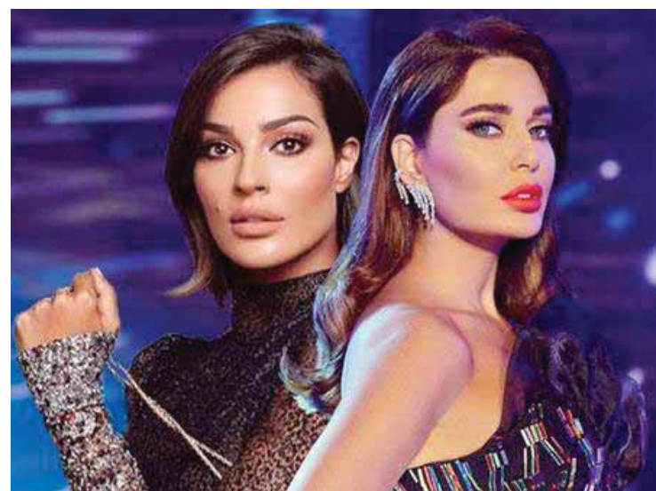
سيرين عبد النور ونادين نجيم

بسرطان الثدي قالت فيها: «جيتي جراحية بسيطة، إنما ستعود لطبيعتها خلال أسابيع. وطمانت ليلى محبيها قائلة: «أنا بخير وبروح وبجي ويطلع وينزل وزى الفل، رفض الأخيرة». وسند بس على عصايا عشان ميقدرش أمشي من غيرها، معرفش ليه مروجي الشاعرات دول مستحلين على موتنا، كل يوم بيوتوا واحد فينا وأحنا لسه على حد أختي بللي مجروحة لأنها فقدت قطعة وش الدنيا». وأعربت عن مدى ازعاجها من الشاعرات التي تتعلق بصحتهم، وتأثيرها على أسرهم، طالبة من الجمع التدقيق قبل نقل الأنباء على المواقع الإلكترونية.