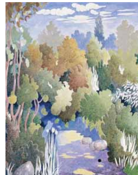
منظر ١٩٩١ - مؤسسة أتاسي

ذهب إلى الفن التجريدي مع الحفاظ على حساسيته الخاصة