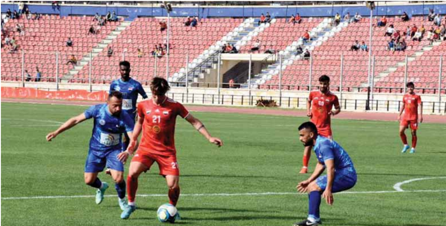
من مباراة الأهلي وجبلة (أرشيف)