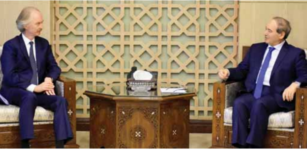
وزير الخارجية والمغتربين فيصل المقداد خلال لقائه المبعوث الخاص للأمم المتحدة إلى سورية غير بيدرسون (ت: مصطفى سالم)

وبعد لقائه مع المبعوث الأممي، عقد وزير الخارجية والمغتربين جلسة مباحثات مع وزيرة خارجية جمهورية دونيتسك الشعبية ناتاليا نيكونوفا والوفد المرافق لها، والذي ضم كلاً من وزير الثقافة والزراعة. ووفق بيان حصلت على نسخة منه «الوطن»، أكد المقداد على أهمية تعزيز العلاقات الناشئة بين البلدين الصديقين في مختلف المجالات السياسية والاقتصادية والثقافية والاجتماعية، وعلى استمرار دعم سورية لجمهورية دونيتسك، وكذلك تأييدها لحق شعوب إقليم دونباس في تقرير مصيرها. وقال: «إن دعم الغرب للإرهاب في سورية بالسلاح وبمليارات الدولارات، هو استمرار لدعاه اليوم للنازيين في أوكرانيا ومدعمهم بالسلاح والمال لمواجهة الموقف الروسي الذي يدافع عن شعب دونباس وحرية وأمنه»، مشيراً إلى أن السياسات الغربية الداعمة للإرهاب في سورية تعوق الجهود السياسية المبدولة لإعادة الأوضاع الطبيعية إليها. بيدروها، عبرت نيكونوفا عن شكرها لسورية على دعمها ومساندتها لجمهورية دونيتسك واحترامها لخبير الشعب في دونيتسك وتأييدها له في الأمم المتحدة.