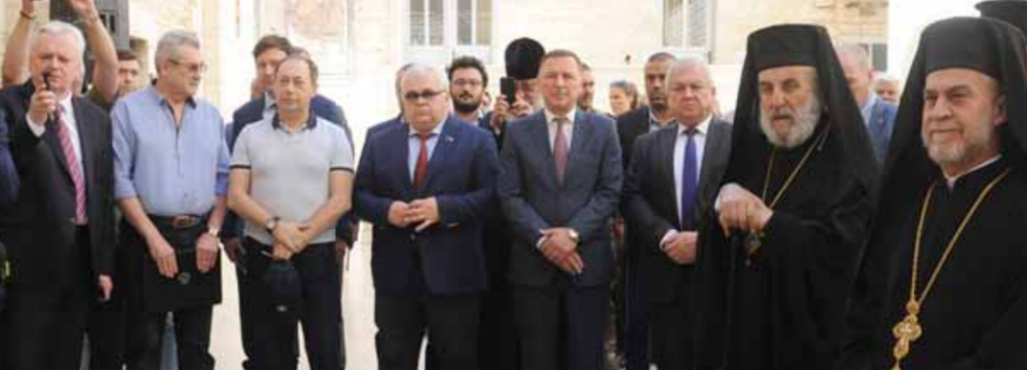
دير مار تقلا في معلولا يتسلم محطة توليد كهرباء بالطاقة الشمسية من روسيا

جلسات مكثفة لمثلي الجانبين بهدف تطوير التعاون الثنائي