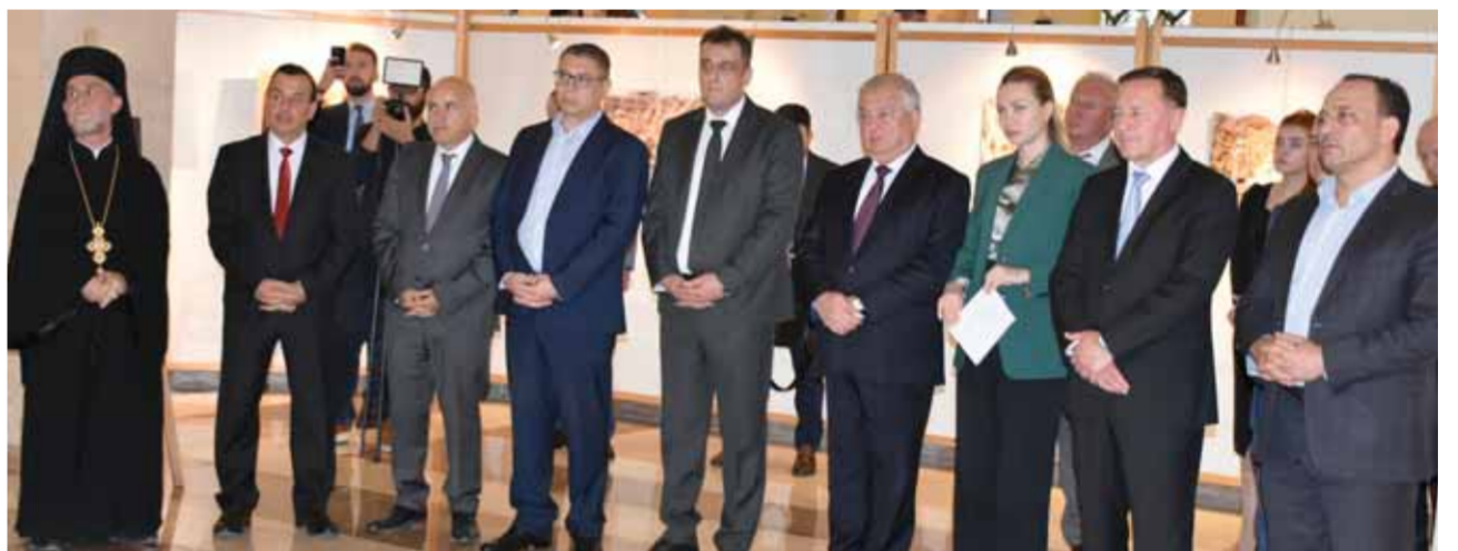
أعضاء من الوفد الروسي خلال افتتاح معرض صور «معلولا- نيكولسكوي» في دار الأوبرا بدمشق

بتدمير التراث الثقافي. وأضاف: «نشاهد اليوم أيضاً تقارباً كبيراً بين سورية وروسيا وجميعنا موجودين في الخط الأمامي في المعركة ضد الإرهاب، وما شاهدناه في هذه الصور هو وجه الإرهاب الموجد في سورية وروسيا، ولكن أهم نتيجة لهذا المعرض بالنسبة لنا أن نقوم بمنع حدوث مثل هذا الدمار الثقافي في العالم». لافرننتيف جدد التأكيد على وقوف بلاده إلى جانب الشعب السوري، وقال: «لا يمكن أن نسمح أبداً أن يستمر الإرهاب بتدمير التراث الثقافي، ونحن مع الشعب السوري الصديق سوف نعمل على ذلك». وفي تصريح مماثل لـ«الوطن» لفتت وزيرة خارجية جمهورية دويتسك