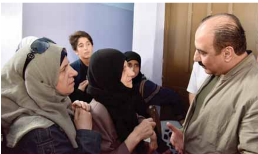
حلب- خالد زكلكو حماة- محمد أحمد خبازي دمشق- الوطن- وكالات

بتوجيه من الرئيس بشار الأسد، زار الأمين العام المساعد لحزب البعث العربي الاشتراكي هلال الهلال أمس معرة النعمان بريف إدلب، ونقل خلال جولته له على مركز استقبال الأهالي العائدين إلى المدينة في مقر النادي الرياضي بمعرة النعمان، تحية الرئيس الأسد، مؤكداً حسب ما أوردت «الصفحة الرسمية لحزب البعث»، حرص الرئيس الأسد على تقديم كل التسهيلات لأهالي معرة النعمان ليعودوا إلى منازلهم وأراضيهم، وتأهيل البنى التحتية لتأمين حياة كريمة لأبناء محافظة إدلب الذين عانوا ما عانوه من ويلات الإرهاب.