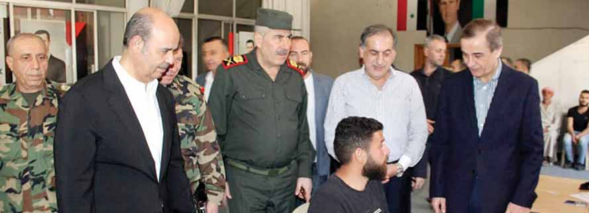
مدير إدارة المخابرات العامة اللواء حسام لوقا برفقة المحافظ قائد شرطة المدينة يتفقدون سير عمليات التسوية في مركز صالة الأسد بمدينة حلب

في حث أبناء مناطقهم وذويهم للاستفادة من هذه الخدمة التي تتيح لجميع المواطنين والمزارعين العودة إلى حياتهم الطبيعية. ومركز صالة الأسد الرياضية، الذي يشهد إقبالاً لافتاً من الراغبين بالتسوية، هو الأول من نوعه في المدينة بعد افتتاح مركز حيان في ٣٠ من آذار الماضي بريف المحافظة الشمالي، أما مركز تل عرن فقد تم افتتاحه في ٣٢ من آذار الفائت بريف المحافظة الشرقية، على حين افتتح مركزاً مسكنة ودير حافر بالريف الأخير أيضاً في ٣١ كانون الثاني الماضي و٢٢ شطاط المنصرم، على التوالي. على خط مواز، أعرب عدد من الذين حضروا لتسوية أوضاعهم في مركز التسوية ببنين بلدية مدينة دوما في ريف دمشق الشرقي في تصريحات نقلتها وكالة «سانا» للأنباء، عن ارتياحهم لانطلاق عمليات التسوية في مناطقهم لتحسين أوضاعهم والعودة لحياتهم الطبيعية.