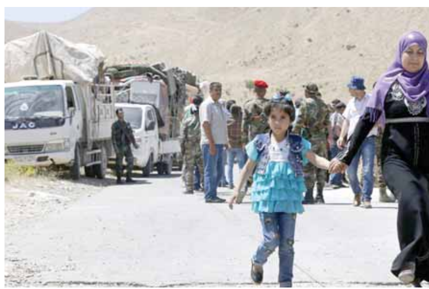
عودة دفعة من اللاجئين السوريين في لبنان

وجدت دمشق التأكيد على أن تحسين الوضع الإنساني في سورية يتطلب وقف الدول الغربية تسييس العمل الإنساني فيها وضرورة دعم مشاريع التعافي المبكر ورفع الإجراءات الاقتصادية القسرية. وفي كلمة له خلال جلسة مجلس الأمن حول الشأن السياسي والإنساني في سورية اعتبر مندوب سورية الدائم لدى الأمم المتحدة السفير بسام صباغ، أن أي وجود عسكري غير شرعي على الأراضي السورية هو انتهاك لميثاق الأمم المتحدة ومخالفة للقانون الدولي ويجب أن ينتهي فوراً إضافة إلى أن محاربة الإرهاب بمختلف أشكاله والقضاء عليه بشكل نهائي لا يمكن أن تتم إلا من خلال التعاون والتنسيق الكامل مع الدولة السورية.