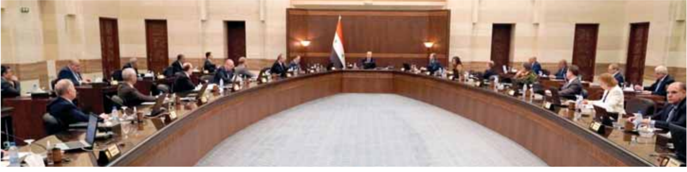
مجلس الوزراء يقر خطة وزارة الإعلام في مجال إدارة وسائل التواصل الاجتماعي وتطوير واقع الإعلام الإلكتروني

مدير عام الدواجن - الوطن: منحة ٨ مليارات ليرة للمؤسسة سترفع الطاقة الإنتاجية إلى ٨٥ بالمئة