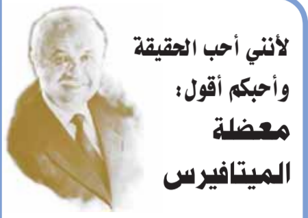
بقلم: طلال أبو غزالة

لأنني أحب الحقيقة وأحبكم أقول: معضلة الميتافيرس لقد ناقشت في الماضي المعضلة التي قد تنتج عن الدعوات لإنشاء الميتافيرس، أي تدعيم لعولمنا المادية من خلال تقنية الواقع الافتراضي والواقع المعزز لإنشاء واقع جديد يعيش فيه الجميع. ففي حين أن فكرة الواقع المعزز بشكل عام لها مزاياها، يبدو أن الحوار الحالي حولها تهيمن عليه تطورات ورؤية مارك زوكربيرج لما يجب أن يشمله مستقبلنا الرقمي على وجه التحديد. فقد أنشأ زوكربيرج العلامة التجارية الجديدة «ميتا»، وتعد باتفاق ١٠ مليارات دولار أميركي لبناء نسخة من الميتافيرس مدعياً أن «ميتا» ستطور أسرع كمبيوتر خارق في العالم يعتمد على الذكاء الاصطناعي.