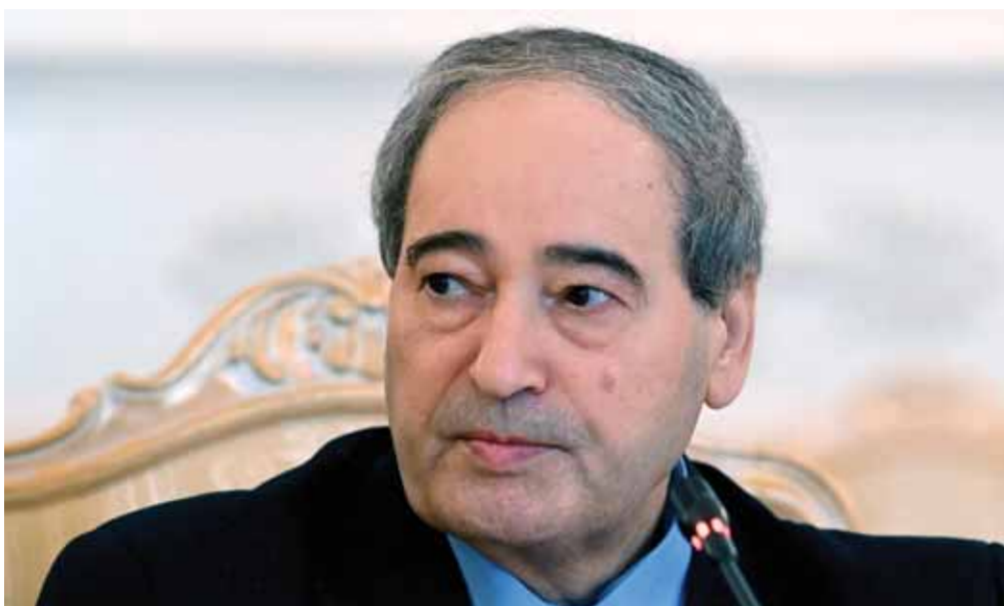
وزير الخارجية والمغتربين فيصل المقداد

شراغ بمدينة شيراز، وأشار المصدر لـ«الوطن» إلى أن الجانب الاقتصادي سيكون حاضراً بالتأكيد خلال هذه الزيارة رغم أنه العنوان السياسي لها، مبيّناً أن السلطة السياسية الإيرانية تؤيد على الدوام التواصل وتطوير التعاون في هذا المجال بين البلدين، كاشفاً بأن الجانبين السوري والإيراني يعملان حالياً على تنفيذ الرؤى والمشروعات المشتركة التي لا تزال موجودة على الورق، والتي من الممكن أن ترى النور قريباً، وقال: «بيد أن هناك شيئاً ما يحضر في الجانب القانوني حتى يمكن لهذه المشاريع أن تتقدم» موضحاً أن «إيران تحاول على الدوام نقل التعاون الذي جرى في الميدان وانتهى بالانتصار على الإرهاب، بأن يترجم على الصعيد الاقتصادي»، مبيّناً أن زيارة وزير الطرق وبناء المدن رستم قاسمي قبل أقل من شهر لدمشق كانت في هذا المنحى، وهناك رؤى كبيرة يمكن أن تتحقق قريباً، منها الربط السكاني بين الجانبين والتي ستعني ثقله كبيرة في التعاون الاقتصادي ليس فقط على مستوى الجانب الثقافي، وإنما على المستوى الإقليمي حيث سيحل العراق على هذا الخط. وختم المصدر تصريحه بالقول: «هناك إرادة سياسية لتحقيق هذه الرؤى وزيارة الوزير المقداد لطهران ليست بعيدة عن هذا الجانب».