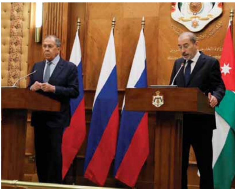
مؤتمر صحفي مشترك لوزير الخارجية الأردنية وروسيا في عمان

حطّ وزير الخارجية الروسي سيرغي لافروف في عمان لزيارة لأفروف للأردن التي بدت لافتة من حيث التوقيت، لأنها جاءت بعد نحو ثلاث سنوات ونصف السنة على زيارته الأخيرة، وتزامناً مع الانشغال الروسي بالعملية الخاصة في أوكرانيا. شكّل الملف السوري فيها محوراً أساسياً للمحادثات ولاسيما التي جمعتها بالملك عبد الله الثاني ووزير خارجيته أمين الصفدي. اللافت في التصريحات الرسمية الأردنية كان التركيز على أهمية الاستقرار في جنوب سورية، حيث يشعر الأردن بالقلق نتيجة ازدياد عمليات التهريب ووجود بؤر إرهابية في هذه المنطقة، فدعا الملك الأردني لتثبيت الاستقرار وخاصة في الجنوب، وضرورة تفعيل جهود التوصل لحل سياسي للأزمة السورية، بما يحفظ وحدة البلاد ويضمن عودة طوعية وأمنة للاجئين، في حين كشف الصفدي خلال مؤتمر صحفي مشترك مع لافروف أن اللقاء بحث في «الخطوات المطلوبة لتثبيت التهديدات المتعددة بتهريب المخدرات والبؤر الإرهابية، وتوفير الحد اللازم من الاستقرار في الجنوب السوري»، واصفاً الوجود الروسي في هذه المنطقة بأنه «عامل استقرار في هذه الظروف التي يبقى فيها الحل السياسي للأزمة هدفاً لم يتحقق»، مشدداً على ضرورة التنسيق الأردني - الروسي في التصدي للتحديات في الجنوب السوري.