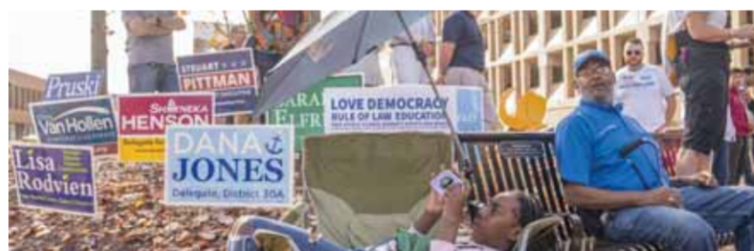
تجمع انتخابي في أنابوليس بولاية ماريلاند

هذا قد يتغير في هذه الانتخابات لأن الجمهوريين يريدون تقليل دعمهم لأوكرانيا إذا فازوا في الانتخابات النصفية. ويتنافس الديمقراطيون والجمهوريون للفوز بانتخابات الكونغرس، سعياً للاستحواذ على تمرير القرارات والتشريعات، حيث يتوقع الديمقراطيون بالأغلبية داخل مجلس الشيوخ، رغم أن نصف المقاعد يملكها الجمهوريون بالتساوي معهم، لكنهم يملكون ورقة طلب تصويت ثانية الرئيس المحسوبة عليهم، وبالتالي ترجح فتحهم في تمرير الأصوات. بدورهم يحتاج الجمهوريون إضافة مقعد واحد ليكونوا أصحاب الأغلبية؛ وبالتالي يكون الرئيس الأميركي جو بايدن مكيلاً بأوامر الحزب المعارض، إذا فقد أغلبية الحزب الذي ينتمي له، وبالتالي يصعب مهمته في الانتخابات الرئاسية القادمة. ويظهر الأميركيون لخمس ولايات سيكون لها كلمة