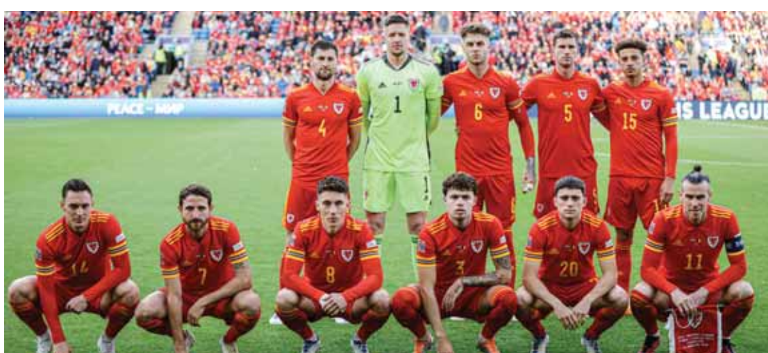
عميد لاعبيها كريس غونتر بـ١٠٩ مباريات وهدافها التاريخي غاريث بيل برصيد ٤٠ هدفاً وكلامها حاضر في النهائيات.