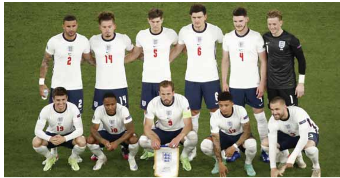
عميد لاعبيها بيتر شيلتون بـ١٢هـ مباراة وهدافها التاريخي واين روني بـ٣٣ هدفاً.

وفي موندبال ٢٠٠٢ سقطوا أمام العقدة البرازيلية بهدف لاشين بعد تجاوز الدانمارك في دور الستة عشر بثلاثة، واحتلال المركز الثاني في دور المجموعات بعد