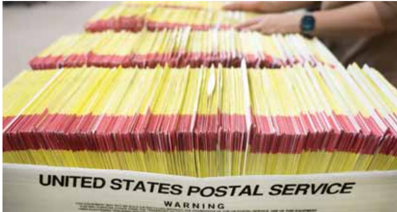
بطاقات الاقتراع عبر البريد في مقر انتخابات مقاطعة سالت ليك

صباح الأحد، وأوضح الموقع أن انتخابات التجديد النصفي التي تمت عام ٢٠١٨ شهدت تصويت ٣٩ مليوناً، واعتبرت حينها النسبة الأعلى في التاريخ الأميركي الحديث، وهذا يعني أن الانتخابات الحالية غير مسبوقة من ناحية التصويت. ولفت إلى أن الإنفاق على الحملات الانتخابية وصل إلى ١٦,٧ مليار دولار على الانتخابات الفيدرالية والمحلية في الولايات المتحدة، وكان الإنفاق الأكبر على المناصب الفيدرالية والسياسية بواقع ٨,٩ مليارات دولار.