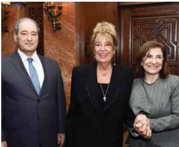
المستشارة بئينة شعبان والقناة منى واصف ووزير الخارجية والمغتربين فيصل المقداد