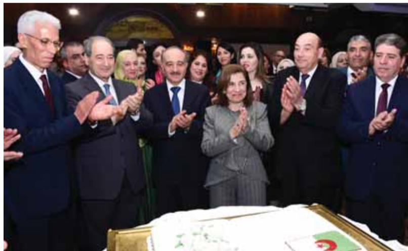
كبار الضيوف خلال تقطيع قالب الحلوى