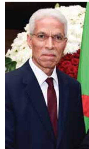
السفير الجزائري لحسن التهامي