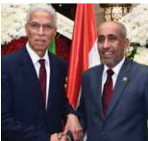
سفيرا عُمان والجزائر