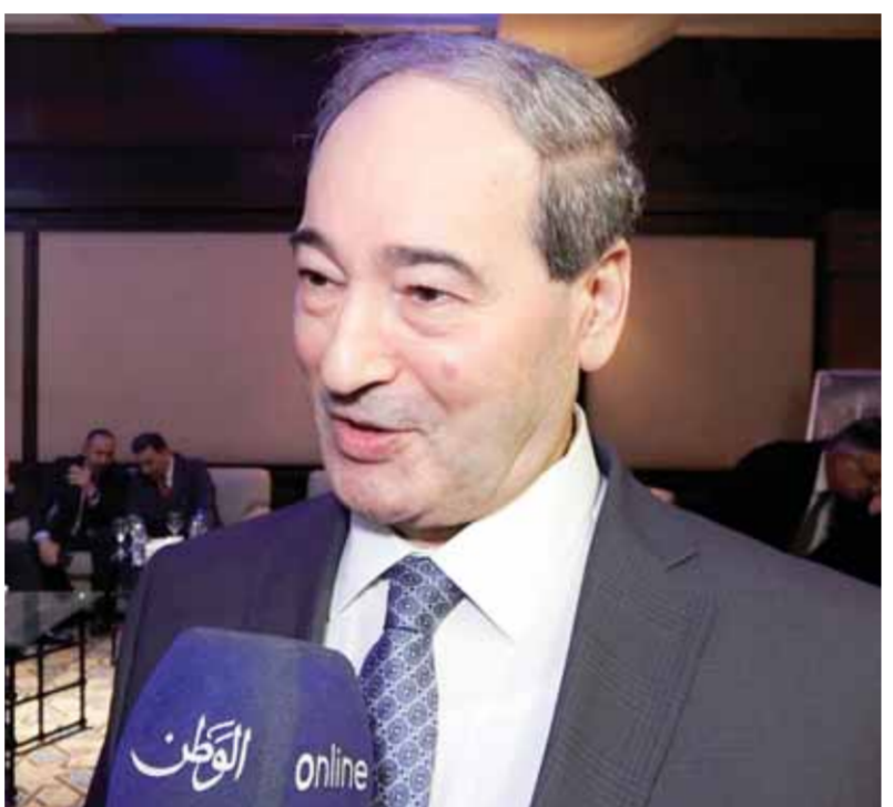
وزير الخارجية والمغتربين فيصل المقداد في تصريح خاص لـ «الوطن»

المستوى الأمني إلى الدبلوماسي، قال المقداد: «نحن نستمتع إلى تصريحاتهم لكن هذا يمكن أن يبدأ بالقفاء على الإرهاب، وبعدهم دعم الإرهاب، والإسحاب العسكري من الأراضي السورية، ووقف أي دعم لجبهة «النصرة» و«داعش»، وهذه كلها خطوات تبرهن عن النيات الحقيقية لهذه الإدارة التركية، على الرغم من كل ما جرى من مباحثات خلال الفترة الماضية». وكان مسؤول تركي أعلن عن نية أنقرة ملاحقة أهداف شمال سورية بعد أن استكمال عملية ضد مسلحي «حزب العمال الكردستاني» في شمال العراق. ونقلت وكالة «رويترز» أمس، عن مسؤول تركي قوله: إن «التهديات التي يشكها المسلحون الأكراد أو تنظيم داعش لتركيا غير مقبولة»، مضيفاً: إن «أنقرة ستقضي على التهديدات إلى حدودها الجنوبية بطريقة أو بأخرى». وقال المسؤول الذي طلب عدم نشر اسمه: «سورية مشكلة أمن قومي بالنسبة إلى تركيا، وهناك عمل يجري القيام به بالفعل في هذا الصدد». وأضاف: إن «هناك عملية جارية ضد حزب العمال الكردستاني في العراق، وأن هناك أهدافاً معينة في سورية بعد استكمال هذه العملية». وكان رئيس النظام التركي أعلن في ٢٣ أيار الماضي، أن الجيش التركي يعتزم تنفيذ عمليات عسكرية «لمكافحة الإرهاب عند حدود تركيا»، موضحاً أن حكومته «ستبدأ اتخاذ خطوات جديدة لاستكمال المنطقة الآمنة بعمق ٣٠ كم شمال سورية».