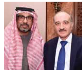
وزير الداخلية محمد الرمحمون والقائم بالأعمال الإماراتي