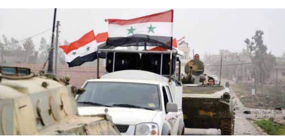
قوات للجيش العربي السوري في محيط درعا البلد

ولفت إلى أن عملية تطهير حي طريق السد من الدواعش كانت بمنزلة ضربة قاصمة للتنظيم الإرهابي في درعا، خاصة أن الحي كان يضم غرفة عمليات ومقر قيادة للتنظيم محصناً منذ سنوات. واعتبر المصدر أن العملية أفادت التنظيم القدرة على إعادة التكتل وتنظيم العمليات؛ بسبب الضربة الموجهة التي تلقاها والخسائر الكبيرة التي لحقت به وبقائه أهم غرف عملياته في الجنوب السوري. هذه المعلومات جنوباً تزامنت مع بدء النظام التركي بأولى خطوات تشكيل «قيادة عسكرية موحدة» من مرتزقة الإرهابيين في المناطق التي يحتلها شمال سورية، تنفيذاً لخرجات اجتماع استخبارات مع متزعمي المرتزقة في مدينة غازي عنتاب في ٢٥ من الشهر الجاري.