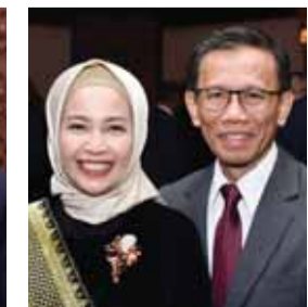
سفير إندونيسيا وعقبته