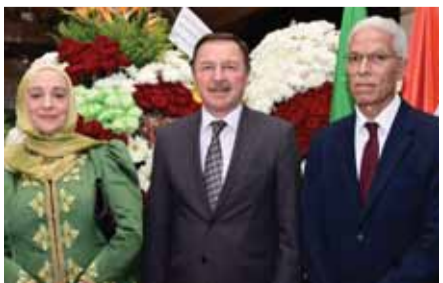
السفير الروسي ألكسندر فيغوف يتوسط السفير الجزائري وعقبته