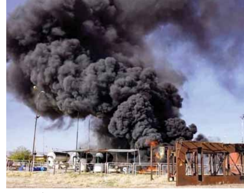
حريق بسبب غارة جوية للاحتلال التركي في محيط تل عودة في ريف الحسكة

الذاتية، في محافظة الحسكة. في غضون ذلك أكدت شعبان، في لقائها على «الفضائية السورية» أن الاحتلال التركي يتخذ ذرائع لشن عدوان على سورية، أولاً لبقاء الإرهابيين الذين يعملون تحت مظلتهم، في الشمال الغربي وثانياً طمعاً في خيرات سورية والعراق، وقالت: «هذا أمر مرفوض دولياً وقانونياً وفي كل اللغات والمعايير، لا يحق لأي دولة الدفاع عن أمنها داخل حدود دولة أخرى، وهذا أمر غير مسبق لأنه سوف يؤدي إلى شريعة الغاب»، مشيرة إلى أن النظام التركي يراوغ مع كل الأطراف، فهو يراوغ مع أميركا وروسيا وإيران وسورية والعراق. وتابعت: «الاتفاق بين النظام التركي وروسيا منذ سنتين كان على أن يميز النظام التركي بين الإرهابيين وبين من يمكن التعامل معهم من المواطنين في شمال غرب سورية، وفي أكثر من تصريح لوزير الخارجية الروسي سيرغي لافروف طلب النظام التركي بأن يقوم بهذه الخطوة، إلا أن أنقرة لم تفعل ذلك». وحول تقارب أنقرة مع دمشق، قالت شعبان: «نسمع التصريحات الإعلامية منذ أشهر، وهم يصرون ولأسبابهم الخاصة سواء انتخابية أم لاستخدامها كورقة ضغط على أطراف أخرى، وهم لهم أجندتهم، ولكن لا علاقة لها بالواقع في الحقيقة». ورداً على مدى تأثير الحرب في أوكرانيا على طبيعة ومستقبل العلاقات بين دمشق وموسكو، قالت شعبان: إننا نشعر بأن العلاقات مع روسيا أصبحت أقوى، فقد اكتشفت موسكو مدى صدق وموثوقية سورية تجاه مواقفها الثابتة على خلفية هذه الحرب.