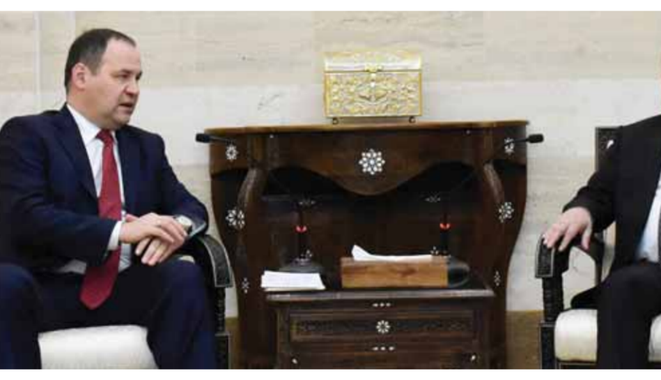
رئيس مجلس الوزراء حسين عرنوس خلال لقائه نظيره البيلاروسي رومان غولوفتشينكو

وفي ختام المباحثات الرسمية الموسعة وقعت سورية وبيلاروس ست اتفاقيات ومذكرات تفاهم في مجالات التبادل التجاري والتربية والإسكان والنقل والصناعة والجمارك. ولدى وصول رئيس وزراء بيلاروس في مستهل زيارته التي تستمر يومين إلى مبنى رئاسة مجلس الوزراء جرت له مراسم استقبال رسمية. وزير الخارجية والمغتربين فيصل المقداد، وخلال لقائه النائب الأول لوزير خارجية بيلاروس البنيك سيرجي فيودورفيتش، أشاد بزيارة الوفد البيلاروسي رفيع المستوى إلى دمشق، وما تعمله هذه الزيارة من دفع للعلاقات الثنائية بين البلدين في عدد من المجالات، وخاصة في المجال الاقتصادي. وعبر عن تقدير سورية للمساعدات البيلاروسية التي ساهمت في تعزيز صمود السوريين في مواجهة الإجراءات القسرية الأحادية الجانب المفروضة على سورية، كما هي مفروضة على بيلاروس ودول أخرى، مجدداً التعبير عن ووف سورية إلى جانب بيلاروس في مواجهة محاولات التدخل الغربي بشؤونها الداخلية، ومحاولات استهداف إنجازاتها والتطور الذي حققت في مختلف المجالات. بدوره أكد فيودورفيتش استمرار بلاده في تقديم المساعدات الإنسانية لسورية وفي الدفع بالعلاقات الاقتصادية بين البلدين في مختلف المجالات.