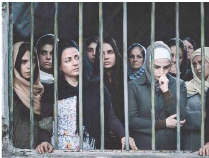
من فيلم «نجمه الصحيح»

جميل وعادل أن يأخذ المبدع إجازة وأجر مدفوعاً ليتفرغ لعمله، فلا تقاطعه شؤون المعيشة الثقيلة وخاصة في زمن الحرب حين يسبطل بفتيتها الفساد والطمع والظلم والنعف، وهذا الأجر المدفوع مسبقاً للمبدع ينبغي أن يأتي أولاً من الدولة أي دولة بعد أن تتأكد لها الجدوى الحقيقية لهذا الإبداع، ولا أرى اليوم وريماً غداً أيًا من هذه الدول قادرة على ذلك أو تأبه له، وفي هذا خطأ كبير، وإن احتجت بظروف الحرب القفرة كبلاندا ولا يعقها هذا العذر، ونحن نسمع عن هدر هنا وهناك، فماذا يتبقي لهذا المبدع إلا أصحاب الشركات والمؤسسات الوطنية أو هكذا يأمل، وفيها مؤمنون صادقون يقربون العلم والفن وجوداً في الاستثمار الإنساني الذي