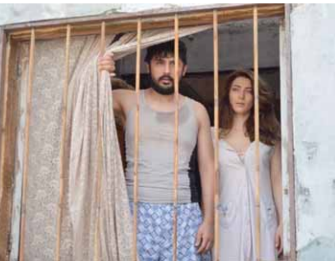
من فيلم «غيوم داكنة»