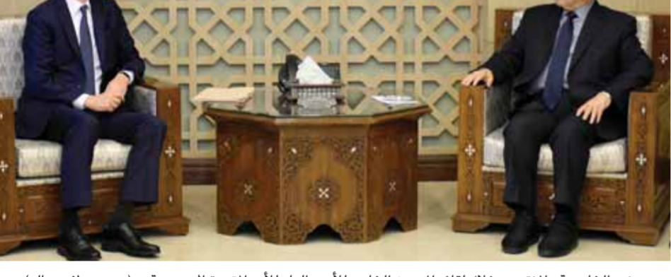
وزير الخارجية والمغتربين خلال لقائه المبعوث الخاص للأمم المتحدة إلى سورية (ت: مصطفى سالم)

وزير الخارجية والمغتربين خلال لقائه المبعوث الخاص للأمم المتحدة إلى سورية (ت: مصطفى سالم) فاضح للسيادة السورية وللقانون الدولي.. وأكد وزير الخارجية والمغتربين فيصل المقداد أمس، أن الأثار السلبية للإجراءات القسرية الغربية على الاقتصاد السوري وعلى حياة السوريين، هي من التحديات الأساسية التي تواجهها سورية. وحسب بيان حصلت «الوطن» على نسخة منه، استعرض المقداد خلال لقائه المبعوث الخاص للأمم المتحدة إلى سورية غير بيدرسون والوفد المرافق، آخر التطورات ذات الصلة بالوضع في سورية والمنطقة والتحديات الأساسية التي تواجهها سورية. وتحدث المقداد عن هذه التحديات وقال إنها «متشعبة بشكل خاص بالآثار السلبية التي خلفها الإرهاب والإجراءات القسرية الأحادية الجانب على الاقتصاد السوري وعلى حياة السوريين، وكذلك استمرار الوجود الأميركي والتركي غير الشرعي على الأراضي السورية في انتهاك